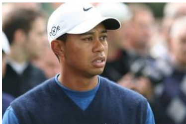
Preisgeldkönig Tiger Woods

07.11.2006 Tiger Woods gewinnt wieder einmal überlegen die Geldrangliste der US PGA Tour. Mit acht Turniersiegen in der Saison 2006 auf der US PGA Tour (davon zwei Majors) ist er der absolute Superstar der Branche. Tiger führt die Preisgeldliste der US PGA Tour mit USD 9,94 Mio an. Auf den Plätzen folgen Jim Furyk , der auch in der Weltrangliste auf Platz zwei hinter Tiger Woods liegt. Adam Scott hat sich durch seinen Sieg bei der Tour Championship in Atlanta ( Story ) auf Platz drei der Moneylist verbessert.