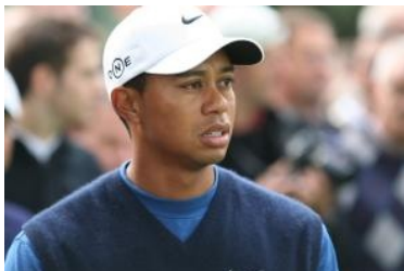
Preisgeldkönig Tiger Woods

07.11.2006 Tiger Woods gewinnt wieder einmal überlegen die Geldrangliste der US PGA Tour. Mit acht Turniersiegen in der Saison 2006 auf der US PGA Tour (davon zwei Majors) ist er der absolute Superstar der Branche. Tiger führt die Preisgeldliste der US PGA Tour mit USD 9,94 Mio an. Auf den Plätzen folgen Jim Furyk , der auch in der Weltrangliste auf Platz zwei hinter Tiger Woods liegt. Adam Scott hat sich durch seinen Sieg bei der Tour Championship in Atlanta ( Story ) auf Platz drei der Moneylist verbessert.