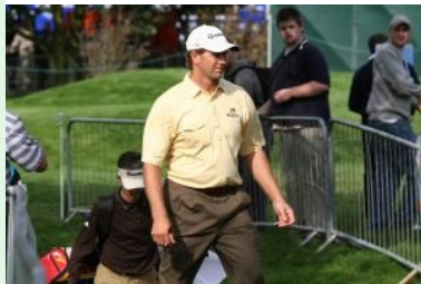
Supergau mit 11 Schlägen an einem Par 5: Retief Goosen (Südafrika)

16.12.2006 Retief Goosen (Südafrika) ist einer der besten Golfer der Welt. Er liegt in den Top-10 der Weltrangliste und er hat bereits Major Turniere gewonnen. Aber das ist offenbar kein Grund, die Golfregeln zu kennen.