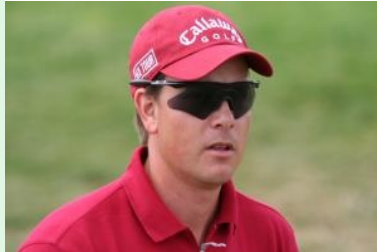
Siegt in Dubai: Henrik Stenson (Schweden)

04.02.2007 Henrik Stenson , der 30-jährige Schwede der in Dubai lebt, feiert quasi einen Heimsieg bei der zur European Tour zählenden Dubai Desert Classic am Emirates Golf Club . Stenson siegt mit einem Gesamtscore von -19/269 (68+64+69+68) einen Schlag vor dem Südafrikaner Ernie Els mit -18/270 (66+65+68+71). Ernie Els gewann das Turnier bereits dreimal und belegte auch letztes Jahr Rang zwei, damals hinter Tiger Woods. Titelverteidiger Tiger Woods (USA) muß sich diesmal mit einem Gesamtscore von -17/271 (68+67+67+69) mit dem dritten Platz zufrieden geben, diesen teilt er sich mit dem Schweden