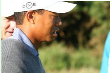
Tiger Woods siegt in Southern Hills

13.08.2007 Bei den bisherigen drei Majors des Jahres war Tiger Woods (USA) zwei Mal geteilter Zweiter ( Masters in Augusta, US Open in Oakmont) und bei den British Open in Carnoustie wurde er "nur" geteilter Zwölfter. Beim letzten Major des Jahres, der 89. PGA Championship am Southern Hills Country Club in Tulsa, Oklahoma klappt es doch noch: Titelverteidiger Tiger Woods gewinnt seinen 13. Major-Titel in seiner Karriere (und das bei nur 44 Major-Starts) und nach 1999, 2000 und 2006 seinen insgesamt vierten PGA Championship Titel. Damit ist Woods nur noch fünf Major Siege von Jack Nicklaus' Rekord von 18 Major Siegen