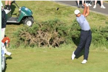
Startet mit eigenem Sportgetränk: Tiger Woods

17.10.2007 Im März 2008 wird Tiger Woods sein eigenes Sport-Getränk auf den Markt bringen. Es wird von der Firma Gatorade - einer Tochter von PepsiCo - in Lizenz verkauft. Es ist dies der erste kommerzielle Deal von Golf Superstar Tiger Woods mit einer Firma in der Getränkebranche und gleichzeitig der erste Deal bei dem ein Lizenzabkommen zum Tragen kommt.