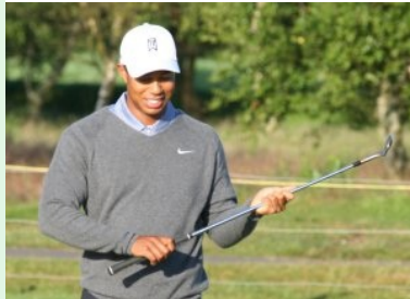
The man to beat: Tiger Woods (USA)

Tiger Woods holte mit seinem Sieg über Y. E. Yang den entscheidenden Punkt für sein Team.