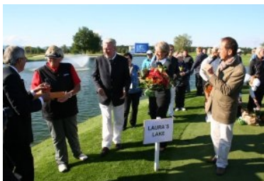
Laura's Lake - Die Taufe