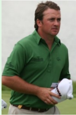
US Open Champion 2010: Graeme McDowell (Nirl)

gewonnen, können aber auf dem extrem schweren Platz in Pebble Beach nicht wirklich Boden gut machen. Das Rough ist dick, die Fairways sind schmal und die Greens in Pebble Beach sind klein. Sechs der Löcher liegen direkt an den Klippen oberhalb des Meeres, dementsprechend stark bläst der Wind. Das sind Bedingungen die Graeme McDowell aus Portrush in Nordirland entgegenkommen. Er behält die Nerven und holt sich nach seinem Sieg bei der Celtic Manor Wales Open vor zwei Wochen in Wales nun den Sieg bei der 110. US Open in Pebble Beach. Graeme McDowell - auch "G-Mac" genannt, gewinnt mit einem Gesamtscore von Even Par/284 (71+68+71+74) einen Schlag vor Gregory Havret (Frankreich). Dritter wird Ernie Els mit einem weiteren Schlag Rückstand. Den vierten Platz teilen sich Phil Mickelson und Tiger Woods (beide USA). Die beiden Deutschen Martin Kaymar und Alex Cejka belegen unter anderen den guten geteilten achten Platz.