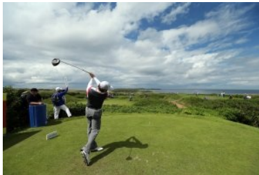
Rory McIlroy in Royal Portrush

Bisher ein einziges Mal waren die Britisch