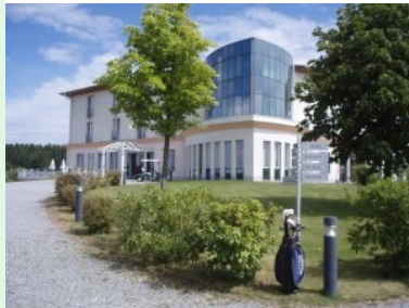
Das Clubhaus in Waidhofen an der Thaya

05.05.2016 - Nicht bezahlte Pachtgelder, bereits kassierte Mitgliedsbeiträge, abgezogene Maschinen und gescheiterte Verhandlungen. So kann man die derzeitige Situation rund um den Golfplatz Waidhofen zusammenfassen. Bereits Anfang April wären die Pachtgelder fällig gewesen, die derzeitige Betreiber-gesellschaft AT Golf hatte mehreren Gruppierungen Kaufangebote unterbreitet und bereits vorher alle Maschinen für die Platzpflege abgezogen, zuvor allerdings hatte der Waidhofen Golf&Country Club den Mitgliedern die Beiträge für das Jahr 2016 vorgeschrieben.