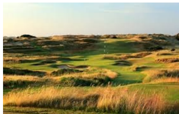
Royal Portrush Golf Club

Nach seiner Annäherung ins 18. Grün läuft Shane Lowry mit erhobenen Armen die letzten Meter zum Grün, strahlt, ballt die Fäuste, klatscht ab, umarmt und lässt sich von den Fans mit Gesängen und Jubel feiern. Ihr Held hatte es geschafft - mit einer 72er Schlussrunde.