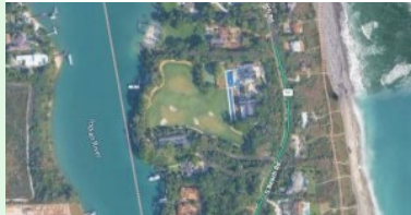
Das 60 Mio Dollar Anwesen von Tiger Woods in Jupiter Island

Woods, der beim Unfall unverletzt blieb, versuchte laut Budensiek auf einer zweispurigen Straße einen Lkw zu