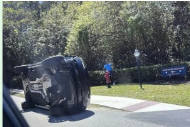
Golfspieler Tiger Woods steht neben seinem umgestürzten Fahrzeug in Jupiter Island

29.03.2026 - Der 15-fache Majorsieger Tiger Woods ist nach einem Autounfall und einem Aufenthalt im Gefängnis wieder frei. Nachdem er eine Urinprobe verweigert hatte, folgte zunächst die Festsetzung. Am Unfallort soll er sich »lethargisch« verhalten haben.