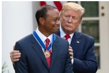
2019 verlieh Donald Trump (damals 72) der Golfkone Tiger Woods (damals 43) die "Medal of Freedom", die höchste zivile Auszeichnung der USA

Experten für Drogenerkennung empfanden Woods am Unfallort als »lethargisch« Die Experten für Drogenerkennung, die Woods am Unfallort untersuchten, empfanden den Golfer als »lethargisch«