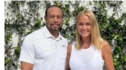
Tiger Woods (50) und seine Freundin Vanessa Trump (48) machten ihre Beziehung im März 2025 öffentlich

überholen. Dabei habe er mit seinem Land Rover das Heck gestreift. Das Fahrzeug kippte daraufhin auf die Fahrerseite, Woods konnte eigenständig herauskrabbeln.