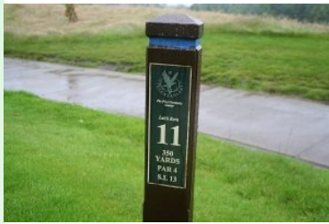
Infotafel am PGA Centenary Course in Gleneagles