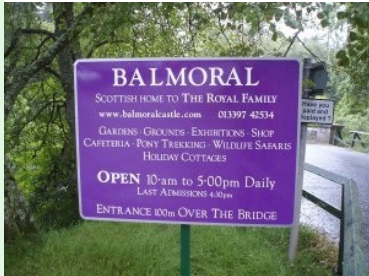
Sommerresidenz der Queen