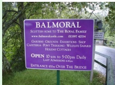
Sommerresidenz der Queen