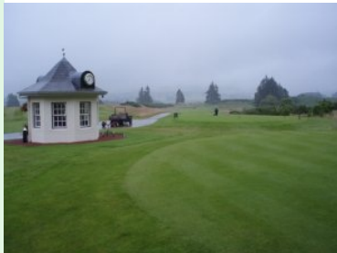
Homepage Balmoral Castle