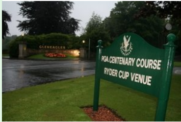
PGA Centenary Course