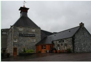
Glenfiddich Whisky Destillerie