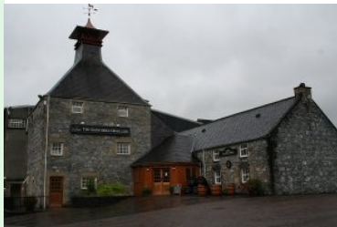
Glenfiddich Whisky Destillerie