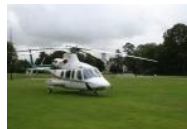
Der Helikopter steht bereit !

Papier- und Verpackungsbranche tätig ist. Dr. Michael Smurfit , der CEO des Unternehmens, hatte das Anwesen, das aus dem 6. Jahrhundert stammt und eine reiche Geschichte aufweist, ab dem Jahr 1988 stückweise erworben und dann in die Smurfit Gruppe eingegliedert. Smurfit hatte die Vision einen American-Style Premium Golfkurs in Irland zu bauen.