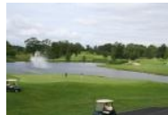
Palmer Course: Blick von der Clubhaus-Terrasse

Die beide Plätze wurden vom US Amerikaner Arnold Palmer designt und haben jeweils eigene Clubhäuser: der Palmer Course , auf dem der Ryder Cup ausgetragen wird, und der Smurfit Course . Der Palmer Course (Eröffnung 1990) ist der ältere der beiden und ein typischer Parklandcourse mit Altbaumbestand und vielen Seen und dem Fluß Liffey , der bei einigen Löchern ins Spiel kommt. Der Smurfit Course (Eröffnung 2003) liegt südlicher und etwas unterhalb des Smurfit Kurses, ist