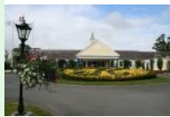
Palmer Course Clubhouse

Die beide Plätze wurden vom US Amerikaner Arnold Palmer designt und haben jeweils eigene Clubhäuser: der Palmer Course , auf dem der Ryder Cup ausgetragen wird, und der Smurfit Course . Der Palmer Course (Eröffnung 1990) ist der ältere der beiden und ein typischer Parklandcourse mit Altbaumbestand und vielen Seen und dem Fluß Liffey , der bei einigen Löchern ins Spiel kommt. Der Smurfit Course (Eröffnung 2003) liegt südlicher und etwas unterhalb des Smurfit Kurses, ist