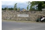
K-Club, Einfahrt Smurfit Course

Will man zum Smurfit Kurs , dann biegt man nicht die Zufahrt zum Straffan House ab sondern fährt noch ca. einen Kilometer weiter Richtung Süden. Auch die Einfahrt zum Smurfit Course ist recht pompös, es geht durch ein großes Tor in der Parkmauer durch und dann an einem Kreisverkehr vorbei Richtung Clubhaus des Smurfit Kurses. Im Unterschied zum Palmer Kurs ist der Smurfit Kurs eben, es gibt fast keine Bäume, der Kurs liegt im Freien und erinnert ein wenig an einen Links-Kurs. Ein Fußweg von ca. 30 min verbindet die beiden Clubhäuser. Man überquert dabei den Fluß Liffey und geht bergauf am Straffan House vorbei zum Clubhaus des Palmer Courses.