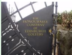
Muirfield: Home of The Honourable Company of Edinburgh Golfers

nach einem weiteren Umzug endgültig auf den jetzigen Platz in Muirfield, Gullane sesshaft wurden.