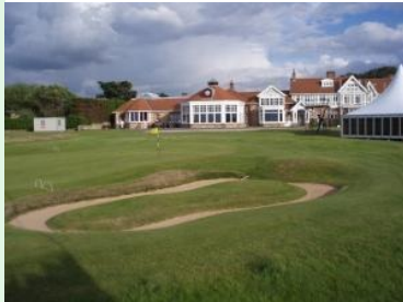
Muirfield - Clubhouse

nach einem weiteren Umzug endgültig auf den jetzigen Platz in Muirfield, Gullane sesshaft wurden.