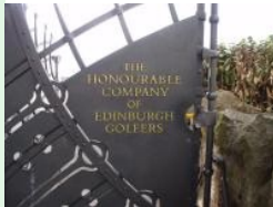
Muirfield: Home of The Honourable Company of Edinburgh Golfers

Den Autos am Parkplatz nach zu schließen ist der Club sehr nobel. Im Unterschied zu St.Andrews und Carnoustie ist der Golfplatz aber abgeschottet. Der total versteckte Platz liegt am Ende des Dorfes Gullane, die honourable Herren legen offensichtlich keinen Wert auf Gäste, weil der Platz überhaupt nicht beschildert ist. Ich musste einen freundlichen Schotten fragen, der gerade in seinem Garten arbeitete, um zu erfahren, dass der Eingang zum Golfclub gleich ums Eck liegt. Nichts desto trotz zählt Muirfield zu den Top-Courses in der Open Rota. Große British Open Sieger wurden hier gekürt - wie beispielsweise Jack Nicklaus (1966) - der sogar sein Muirfield Village in Ohio danach benannte, oder Nick Faldo (1987, 1992) und Ernie Els (2002).