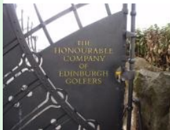
Muirfield: Home of The Honourable Company of Edinburgh Golfers

die Honourable Edinburger Herren aber noch am 5-Loch Platz in Leith gespielt, ehe sie 1836 auf den 9-Loch Platz in Musselburgh übersiedelten um 1891 dann nach einem weiteren Umzug endgültig auf den jetzigen Platz in Muirfield, Gullane sesshaft wurden.