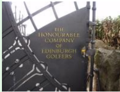
Muirfield: Home of The Honourable Company of Edinburgh Golfers

Den Autos am Parkplatz nach zu schließen ist der Club sehr nobel. Im Unterschied zu St.Andrews und Carnoustie ist der Golfplatz aber abgeschottet. Der total versteckte Platz liegt am Ende des Dorfes Gullane, die honourable Herren legen offensichtlich keinen Wert auf Gäste, weil der Platz überhaupt nicht beschildert ist. Ich musste einen freundlichen Schotten fragen, der gerade in seinem Garten arbeitete, um zu erfahren, dass der Eingang zum Golfclub gleich ums Eck liegt. Nichts desto trotz zählt Muirfield zu den Top-Courses in der Open Rota. Große British Open Sieger wurden hier gekürt - wie beispielsweise Jack Nicklaus (1966) - der sogar sein Muirfield Village in Ohio danach benannte, oder Nick Faldo (1987, 1992) und Ernie Els (2002).