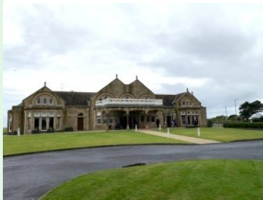
Royal Troon Clubhaus