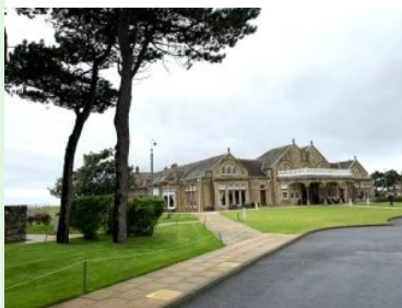
Das Clubhaus des Royal Troon Golf Club