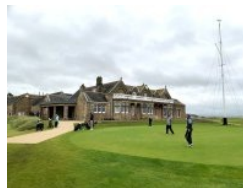
Royal Troon Putting Green

Neben dem Golfshop lohnt sich für Besucher auch der kurze Spaziergang seitlich beim Clubhaus vorbei raus Richtung Meer zu Tee 1- man kriegt einen Eindruck über die Herausforderungen eines Links Courses. Auffallend ist auch der Segelmast, der neben dem Putting Green hinter dem Clubhaus in den Himmel ragt.