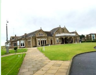
Das Clubhaus des Royal Troon Golf Club

Nobler Golf Club an der schottischen Westküste, gegründet 1878 und Teil der Open Rota