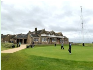
Royal Troon Putting Green