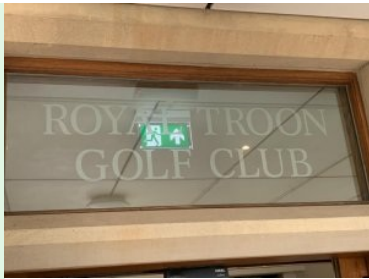
Royal Troon Golf Club