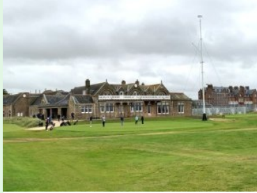
Royal Troon Putting Green