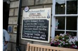
Claret Jug Restaurant

Der Old Course selbst macht auf dem ersten Blick einen harmlosen Eindruck. Wären da nicht die gewaltigen Bunker, würde man nicht wirklich merken, dass man am Golfplatz ist. Der Platz kommt ohne optischen Schnickschnack aus. Spaziert man vom Clubhouse Richtung Old Course Hotel, passiert man zwangsläufig die Swilcan Bridge - das Postkartenmotiv schlechthin in St.Andrews. Nach der Foto-Session ging's weiter raus, am Old Course Hotel vorbei. Der Old Course macht in diesem Bereich einen Schwenk Richtung Norden. Der Old Course ist der am weitesten im Landesinneren liegende Golfkurs in St.Andrews, innerhalb liegt nur noch die Drivingrange, dann folgt schon die Bundesstraße. Zwischen Old Course und Meer liegen noch weitere Links Course (New Course, Jubilee Course,...), wobei das Old Course Club House den zentralen Startpunkt am Meer darstellt.