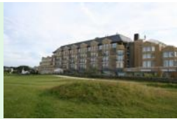
Das Old Course Hotel am Loch 17 (Par 4)

über die Fairways. Man kann auch in Bunker steigen und nicht einmal die Grüns sind abgesperrt. Man muss sich das einmal vorstellen - das wäre so, wie wenn Fontana am Sonntag als Park für Spaziergänger geöffnet wäre !