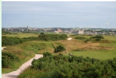
Ginsterbüsche am Old Course, dahinter St.Andrews

typische schottische Stadt mit vielen Bars, Kinos, u.s.w. Geht man die Straße Richtung Clubhouse hinunter zum Meer häufen sich Golfshops und Bars für golf-affine Kunden. Namen wie "Claret Jug Restaurant", "Scorecards Bar" oder "Old Tom Morris Shop" zeugen davon, dass Golf hier absolut im Mittelpunkt steht. Wenn man dann das erste Mal vor dem altherwürdigen Clubhouse in St.Andrews steht, dann fühlt man fast ein bisschen Ehrfurcht vor dieser langen Tradition.