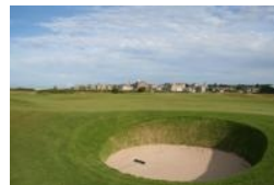
Blick zurück vom Old Course nach St.Andrews

In St.Andrews gibt's auch die älteste Universität Schottlands und die drittälteste von Großbritannien. Neben Oxford und Cambridge gilt St.Andrews als die Elite-Universität. Prinz Williams schloss im Jahr 2005 sein Geographie-Studium in St.Andrews ab. Von den ca. 18.000 Einwohnern von St.Andrews sind ein Drittel Studenten.