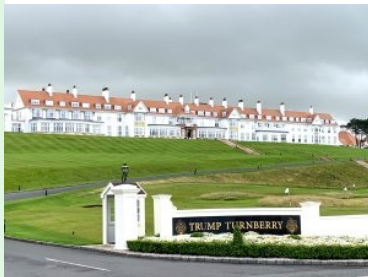
Das Hotel des Trump Turnberry Resort

September 2024 - Neben Royal Troon ist Turnberry der zweite legendärer Championship Course an der schottischen Westküste. Donald Trump (später zweimaliger US Präsident) kaufte das Resort (Golfplätze + Hotel) im Jahr 2014 um 60 Mio USD und angebliche weitere 200 Mio USD wurden in die Renovierung des Platzes gesteckt, seitdem heißt das Resort Trump Turnberry . Die Anlage liegt ca. 70 km südwestlich von Glasgow in der Grafschaft Ayrshire an der schottischen Westküste. Turnberry liegt ca. 30 km südlich von Royal Troon.