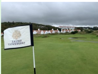
Übungsplatz mit Villas und Hotel im Hintergrund