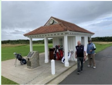
Starthaus Ailsa Course (British Open)