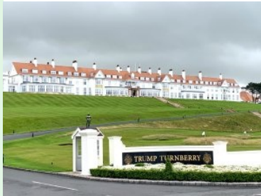
Das Hotel des Trump Turnberry Resort

September 2024 - Neben Royal Troon ist Turnberry der zweite legendärer Championship Course an der schottischen Westküste.