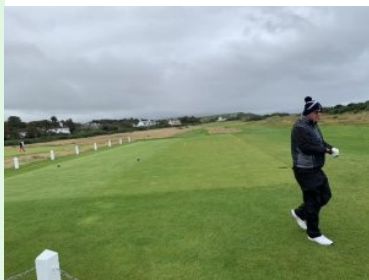
Ailsa Course, Tee 1