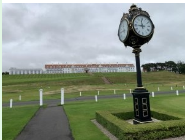
Blick hinauf zum Hotel