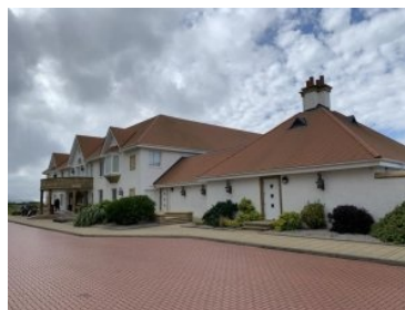
Das Clubhaus in Turnberry

Das Turnberry Resort liegt auf einer dreiecksförmigen Halbinsel. An der Küste liegt der Ailsa Course, dahinter dann der "King Robert The Bruce" Course. Vom angrenzenden Clubhaus ist es nur ein paar Schritte zu beiden Golfplätzen und zur Drivingle. Eine Straße trennt die Golfplätze vom Hotel, das langgezogene Hotelgebäude mit dem Ballroom liegt auf der anderen Seite der Straße, landeinwärts auf einer leichten Anhöhe liegt. Villas (ein Villen Dorf), welche auch zum Resort gehören, stehen am Fuß der Anhöhe.