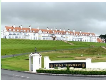
Blick hinauf zum Hotel