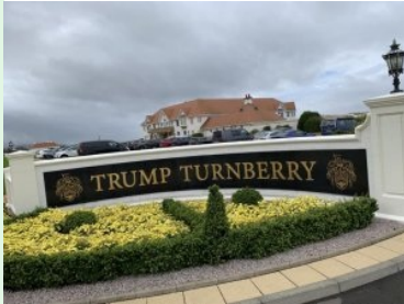
Die Einfahrt zum Trump Turnberry Resort mit Clubhaus im Hintergrund