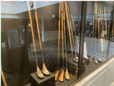
Historische Schläger in den Clubhaus Vitrinen