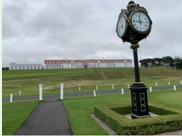
Blick hinauf zum Hotel