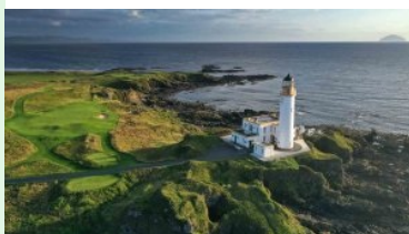
Der markante Leuchtturm in Turnberry, im Hintergrund die Insel Ailsa Craig