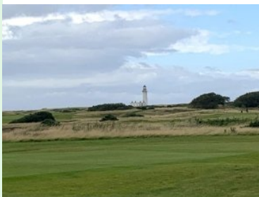
Blick hinaus zum Leuchtturm