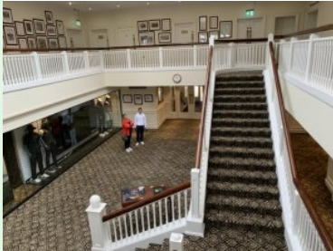
Atrium im Clubhaus