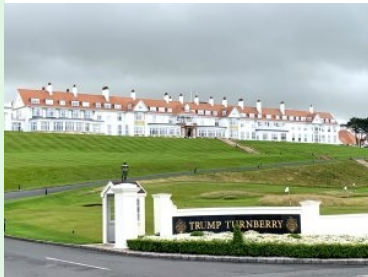
Das Hotel des Trump Turnberry Resort

genannten Turnus der Plätze, die die British Open austragen dürfen. Große British Open Sieger wurden in Turnberry gekürt - wie beispielsweise Tom Watson (1977 im " Duell in the Sun " mit Jack Nicklaus ) bzw. Greg Norman (1986), Nick Price (1994) und Stewart Cink (2009). Seit dem Sturm auf das Washingtoner Capitol und der Mittäterschaft von Donald Trump ist Turnberry nicht mehr Teil der Open Rota.