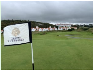
Übungsplatz mit Villas und Hotel im Hintergrund