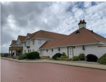
Das Clubhaus in Turnberry

Das Resort besteht aus zwei 18-Loch Plätzen (der Championship Course " Ailsa " und dem " King Robert The Bruce " Course). Turnberry mit dem Ailsa Course war Teil des "Open-Rota"