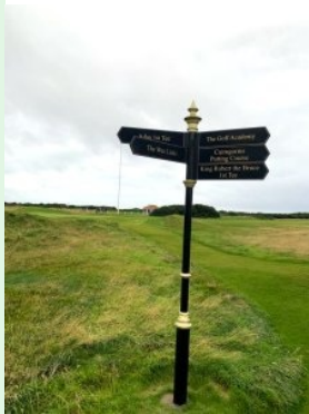
Wegweiser in Turnberry