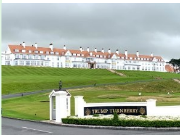
Blick hinauf zum Hotel