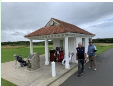
Starthaus Ailsa Course (British Open)