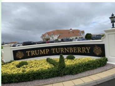
Die Einfahrt zum Trump Turnberry Resort mit Clubhaus im Hintergrund

September 2024 - Neben Royal Troon ist Turnberry der zweite legendärer Championship Course an der schottischen Westküste. Donald Trump (später zweimaliger US Präsident) kaufte das Resort (Golfplätze + Hotel) im Jahr 2014 um 60 Mio USD und angebliche weitere 200 Mio USD wurden in die Renovierung des Platzes gesteckt, seitdem heißt das Resort Trump Turnberry . Die Anlage liegt ca. 70 km südwestlich von Glasgow in der Grafschaft Ayrshire an der schottischen Westküste. Turnberry liegt ca. 30 km südlich von Royal Troon.