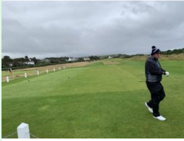
Ailsa Course, Tee 1