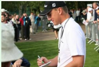
Robert Karlsson (Schweden)

November 2008 - Der 39-jährige Schwede Robert Karlsson sichert sich mit einem 32. Platz beim Saisonfinale, dem Volvo Masters in Valderrama die Harry Vardon Trophy für den Gewinn der European Tour Order of Merit mit einem Gesamtpreisgeld von EUR 2,723 Mio vor dem zweifachen Major Sieger Padraig Harrington aus Irland.