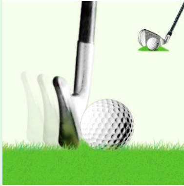
Beim fetten Schlag trifft der Schläger den Boden vor dem Ball

Möglicherweise sind sie zu weit rechts beim Abschwung. Behalten sie ihre Haltung ohne den Kopf zu senken. Verlagern sie ihr Gewicht. Zum Zeitpunkt des Ballkontakts sollten sie 80% des Körpergewichts am vorderen Fuß haben.