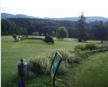
Blick von Tee 6 über den hinteren Teil des Platzes