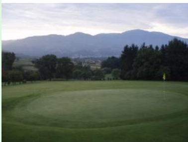
Blick von Grün 1 hinunter nach Wolfsberg