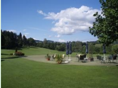
Die Driving Range mit Fairway 1 im Hintergrund