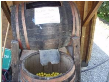
Ein Fass als Rangeball Behälter