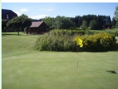
Das Putting Grün mit mehreren Plateaus