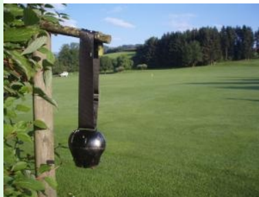
Achtung: Range-Überquerung - die Kuhglocke an Fairway 9