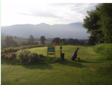
Blick von Tee 6 über das Lavanttal Richtung Koralm