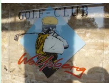
Zurück im Clubhaus