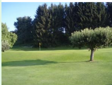
Das wunderschön gelegene Grün 9