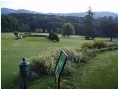
Loch 3 (Par 3) mit Teich