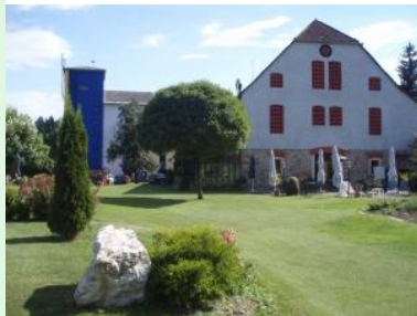
Willkommen im GC Wolfsberg !