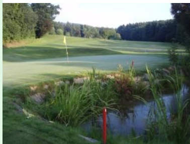
Wunderschön: Grün 7 (Par 4) mit Teich