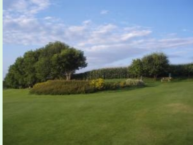
Blick vom Fairway 6 hinauf zum Tee