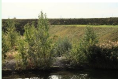
Golf S1 Pitch&Putt Kurs