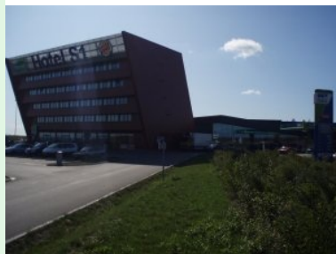
Die S1 Raststation zwischen Schwechat und Vösendorf

Infrastruktur der benachbarten Raststation: Businesshotel Marche/Möwenpick, Restaurant/Frischemarkt mit eigener Bäckerei und Grill, Cafe, Burger King, 24h Bar,...)