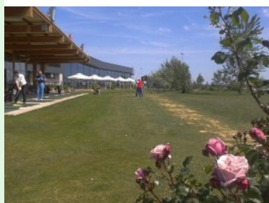
Golf S1 Drivingrange