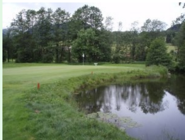
Grün 7 (Par 3, 111 m) mit Teich