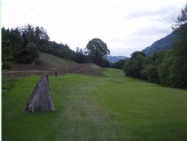
Loch 11: das alte (rechts) und das neue Fairway (links)