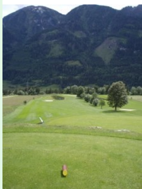
Blick vom Tee 1 (Par 4) hinunter zum Grün