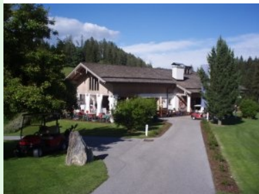
Willkommen im Golfclub Goldegg