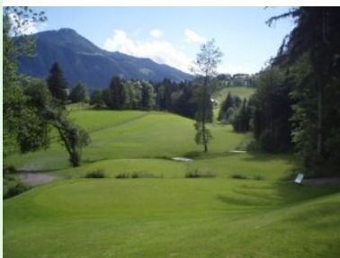
Blick von Tee 17 (Par 5, 464 m) hinunter Richtung Fairway