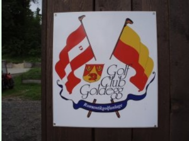
GC Goldegg Logo