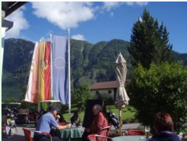
Auf der Clubhaus-Terrasse