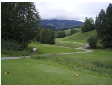
Blick vom Tee 9 (Par 4) Richtung Landezone (beim Strommasten)