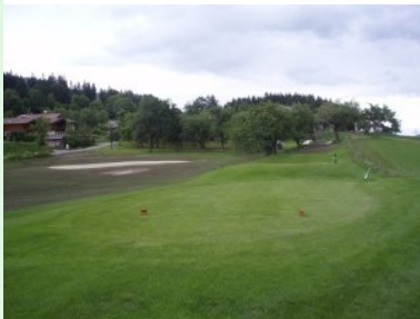
Blick vom Tee 13 zurück zum neuen Grün 12