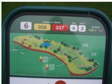
Infotafel in Goldegg