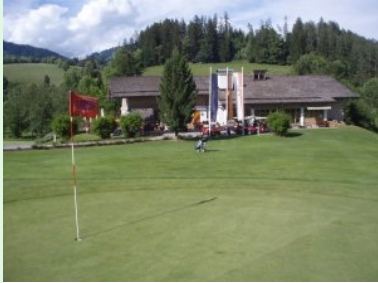
Blick von Grün 18 Richtung Clubhaus