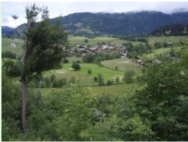
Blick von Tee 10 hinunter nach Goldegg