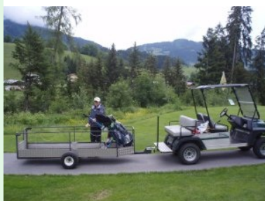
Shuttle hinauf zu Tee 10