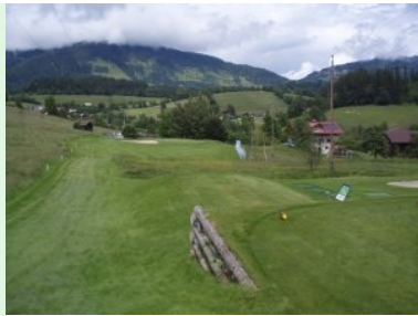
Loch 3 (Par 3, 150m)