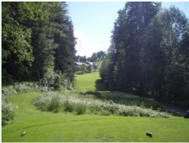
Blick von Tee 18 (Par 4) über den Graben Richtung Landezone (hinter der Waldschneise)