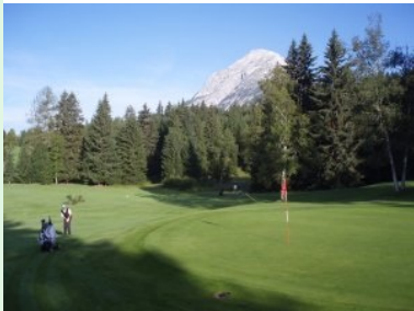
Grün Loch 1 (Par 4, 301m) mit Hoher Munde