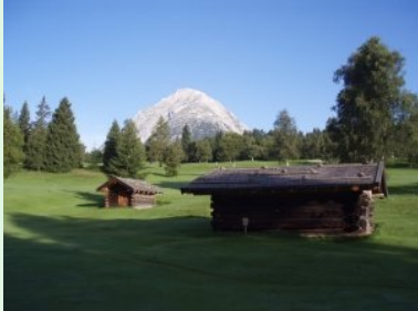
Fairway 1 mit Hoher Munde im Hintergrund