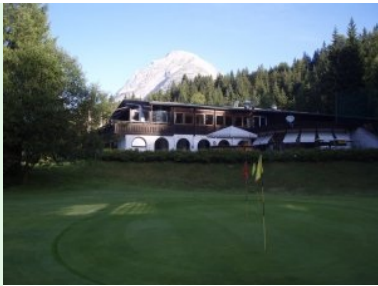
Blick von der Range aufs Clubhaus, dahinter die Hohe Munde