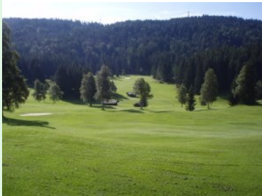
Blick von Fairway 5 hinunter zu Loch 4, 1 und 2