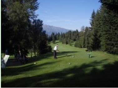
Abschlag Loch 4 (Par 4, 342m)