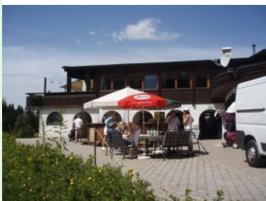
Zurück im Clubhaus