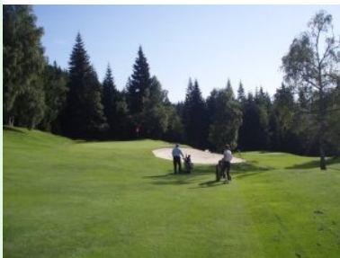
Grün Loch 5 (Par 3, 177m)