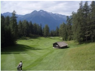
Die zweite Hälfte von Loch 14 (Par 5, 506m)