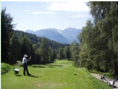
Loch 17 (Par 3, 158 m) mit tief unten liegendem Grün