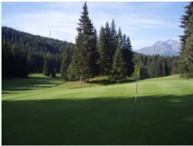
Grün Loch 3 (Par 4, 342m)