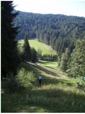
Loch 9 (Par 3, 142m) steil bergab; unter dem Grün versteckt das Clubhaus und dahinter die Drivingrange