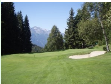
Grün Loch 8 (Par 4, 233m)