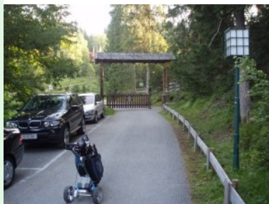
Der Weg vom Parkplatz rauf zum Clubhaus