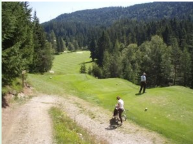
Loch 18 (Par 4, 277m)