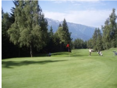
Blick vom Grün Loch 11 (Par 4, 271m) zurück