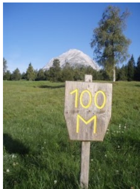
Distanzmarkierungen aus Holz