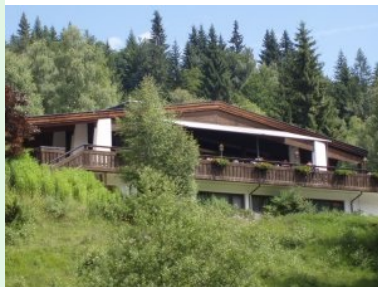
Herzlich willkommen im GC Seefeld-Wildmoos !