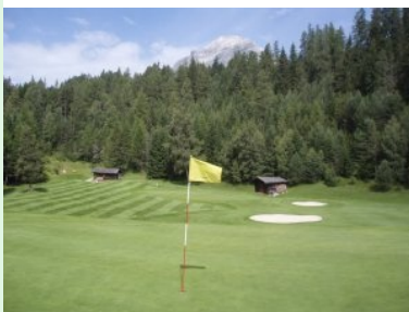
Blick vom Grün 13 (Par 3) zurück zum Abschlag links oben; rechts Grün 12