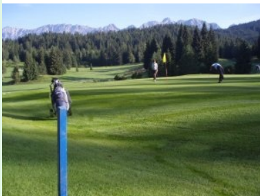
Grün Loch 2 (Par 4, 307m)