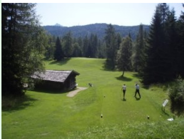
Loch 13 (Par 3, 144m) mit dem erhöhten Green hinten am Waldrand