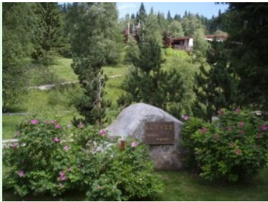
Auf Wiedersehen im GC Seefeld-Wildmoos