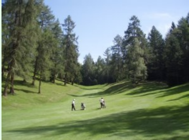
Annäherung Grün Loch 15 (Par 4, 313m)