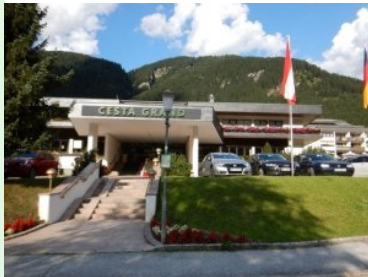
CESTA GRAND Aktivhotel & Spa in Bad Gastein

Nur ein Par 3 vom Clubhaus des Golfclubs Gastein entfernt