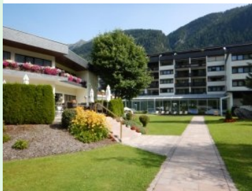
Liegewiese des CESTA GRAND Aktivhotel & Spa

Wenige Schritte von der Hotel-Lobby entfernt - nur getrennt durch eine Nebenstraße und der rauschenden