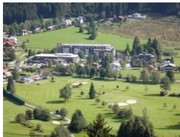
CESTA GRAND Aktivhotel & Spa mit Golfplatz

Das ehemalige renommierte Traditions Haus Europäischer Hof trägt nun nach Eigentümer- und Betreiberwechsel den Namen CESTA GRAND Aktivhotel & Spa. Während Stammgäste auch weiterhin die gewohnt hohen Qualitäts- und Service-Standards erwarten dürfen hat sich das Erscheinungsbild des öffentlichen Bereichs im CESTA GRAND Aktivhotel & Spa grundlegend geändert, der Empfangsbereich ist jetzt lichtdurchflutet. Eine moderne Lobby im Lounge Stil dient sowohl als Treffpunkt mit einladenden Sitzgruppen, bietet aber auch ruhige Ecken für eine gepflegte Tasse Kaffee und die Lektüre der Lieblingszeitung.