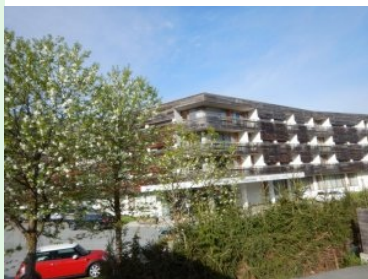
Falkensteiner Hotel & Spa Carinzia

Ein Paradies für Aktiv- & Wellnessurlauber am Fuße des Nassfeld im Kärntner Gailtal