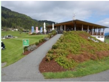
Clubhaus Nassfeld Golf

18 Loch Platz des GC Gaitalgolf mit 6-Loch Übungsgelände, einer Driving Range und einem Putting Green. Hier werden Carinzia-Gäste mit gratis Greenfee verwöhnt. Auch Shuttleservice und bevorzugte Abschlagszeiten lassen das Golferherzen höherschlagen. Die Falkensteinergruppe ist Mitigentümer der Golfanlage Nassfeld Golf.