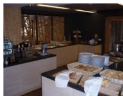
Frühstück im Living Hotel Max

Nicht unerwähnt bleiben soll an dieser Stelle das herrliche Bergpanorama mit den schneebedeckten Bergen (z.B. das Kitzsteinhorn 3.203 m) rund um Zell am See. Golferherz was willst du mehr? Spielberichte von den vier Plätze gibt es in Kürze hier auf golftreff.at .