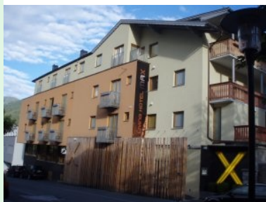
Living Hotel Max in Zell am See

Ich war im Juni 2009 zu Gast im Living Hotel Max in Zell am See. Das Hotel liegt sehr zentral in einer Häuserzeile. Sowohl zur Fußgängerzone (mit netten Bars und Straßencafés) als auch zum See sind es nur wenige Schritte. Das Hotel bietet vor allem ausgezeichnetes Essen. Das Frühstück ist sehr umfangreich - es wird die ganze Palette vom Rührei bis hin zum Joghurt angeboten. Fast noch exklusiver ist das Abendessen, jeweils ein