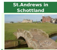
St. Andrews in Schottland

In einem Bereich von 50 Straßenkilometern rund um Maria Alm gibt es sechs wunderschöne Golfplätze. Quasi vor der Haustür liegt der wunderschöne Platz des Golfclubs Urslautal . Der Platz des Golfclubs Brandlhof besticht nicht nur