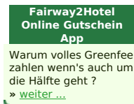
Fairway2Hotel Online Gutscheine App