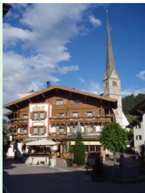
Hotel Eder in Maria Alm

Golfen, Bogenschießen, Canyoning, Klettern, Wandern, Raften und Genießen - und das alles mit „Meerblick“ im Steinernen-Meer-Hotel Eder in Maria Alm