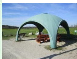
Halfway House Freibereich

Auf Loch 7 lauert ein Fairwaybunker in der Landezone auf ungenaue Bälle und dann kommt's richtig dick: der Seitenarm eine Teichs ragt von der rechten Seite in das Fairway vor dem Grün und zu allem Überdruß steht rechts auch noch ein singulärer, ausladender Baum der das Anspielen des Grüns auf der rechten Seite praktisch unmöglich macht - für mich das Signaturehole des Platzes. Das nachfolgende Par 3 von Loch 8 führt dann in die entgegengesetzte Richtung. Auch hier lauert ein Seiten- arm des Teichs der rechts vor dem Grün ins Fairway reinzüngelt auf ungenaue Teeshots. Das Halfwayhouse ist in Form einer Holzhütte ausgeführt, der Freibereich mit massiven