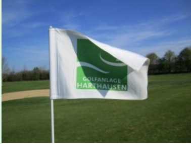
Flagge Golfanlage Harthausen