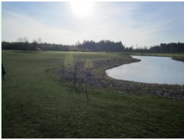
Loch 17 (Par 3, 150m)