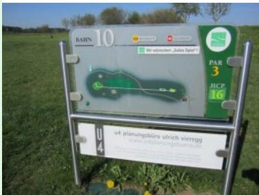
Infotafel auf der Golfanlage Harthausen