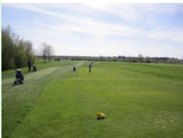
Abschlag Loch 3 (Par 4, 287m)