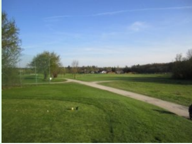
Abschlag Loch 18 (Par 4, 317m)