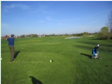
Loch 14 (Par 3, 123m)