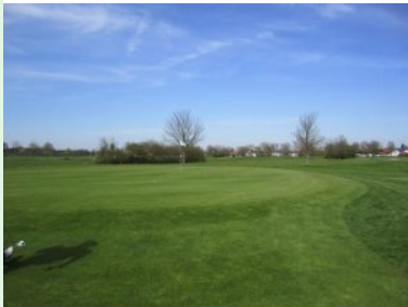
Grün Loch 1 (Par 4, 270m)