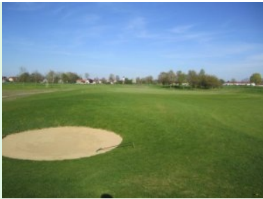
Grün Loch 11 (Par 5, 498m)