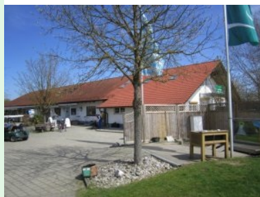
Willkommen auf der Golfanlage Harthausen!

April 2016 - Harthausen ist Teil der Gemeinde Grasbrunn und liegt rund 18 Kilometer südöstlich des Stadtzentrums von München ein paar Kilometer außerhalb des Autobahnringes rund um München. Die 18-Loch Golfanlage Harthausen gehört zur Golfrange Deutschland GmbH und damit zur österreichischen Murhofgruppe.