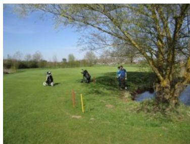
Grün Loch 7 (Par 4, 312m)

Herausforderung macht. Das Clubhaus liegt im Süden der Golfanlage. Die Front-Nine (Par 34) bilden eine Schleife nordöstlich des Clubhauses, die Back-Nine (Par 35) liegen weiter nördlich wobei man nach 9 Loch nicht zum Clubhaus zurück kommt, die Front-Nine enden hinter der Drivingrange. Die ersten Löcher spielen sich relativ gemütlich. Die Landezonen sind breit genug um bei längeren Bahnen am Tee zum Driver greifen zu können. Loch 7 (Par 4, 312m von gelb) und Loch 8 (Par 3, 133m) sind dann die ersten Löcher an denen Wasser ins Spiel kommt: