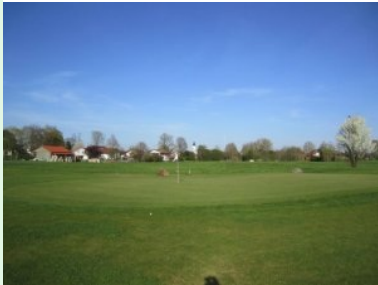
Grün Loch 14