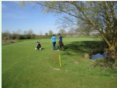
"Anglerparadies" Grün Loch 7