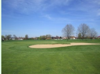
Grün Loch 4