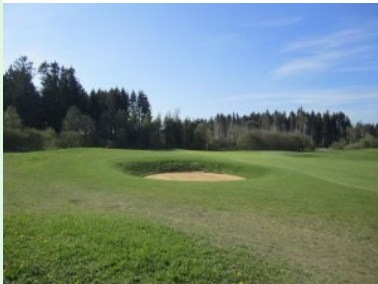
Annäherung Grün Loch 10 (Par 3, 169m)