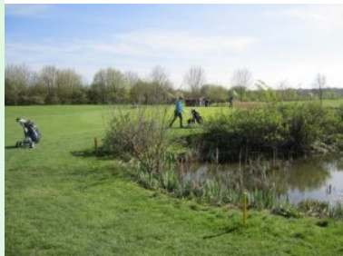
Grün Loch 8 (Par 3, 133m)