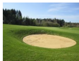
Grün Loch 10 (Par 3, 169m)

Extra-Portion Herausforderung. Die Löcher 13, 14 und 15 bilden die nördliche Grenze der Anlage. Insbesondere das Par 3 von Loch 14 erfordert einen exakten Teeshot, rechts vor dem Grün lauert der Teich. Die Herausforderung von Loch 16 (Par 4, 359m) ist ein Wassergraben der das Fairway quert. Loch 17 (Par 3, 150m) wird gar auf der kompletten