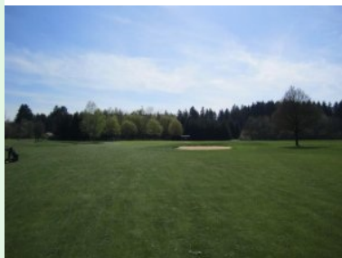
Grün Loch 6 (Par 5, 451m)