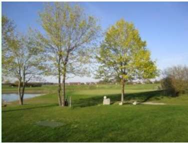
Blick zurück auf Grün Loch 16

begrenzt. Loch 18 (Par 4, 317m) ist ein wunderschönes Abschlussloch, es führt hinter der Driving Range zurück zum Clubhaus. Das Dogleg links ist Halbkreis-ähnlich angeordnet, durch geschicktes Wählen der Richtung des Teeshots in Kombination mit der Länge kann man die Bahn quasi abkürzen. Da das Fairway aber nicht allzu breit ist muss der Teeshot genau sein damit der Ball nicht im Rough landet.