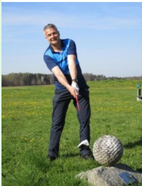
Golfball aus Stein