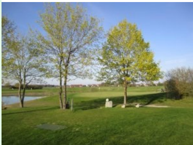
Blick zurück auf Grün Loch 16