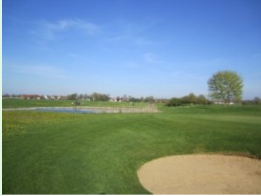
Grün Loch 13 (Par 4, 414m)