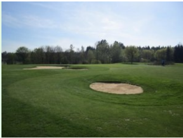
Grün Loch 9 (Par 4, 248m)