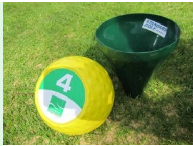
Teebox Marker der Golfanlage Harthausen