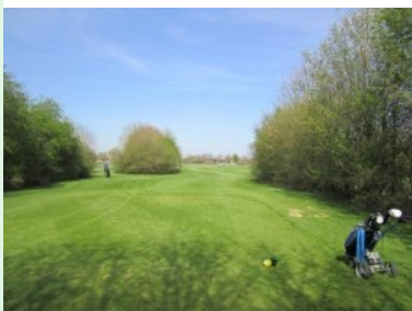
Abschlag Loch 4 (Par 4, 357m)