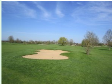
Fairwaybunker Loch 7 (Par 4, 312m)