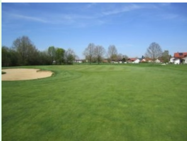
Grün Loch 2 (Par 3, 195m)