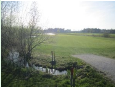
Loch 16 (Par 4, 359m)