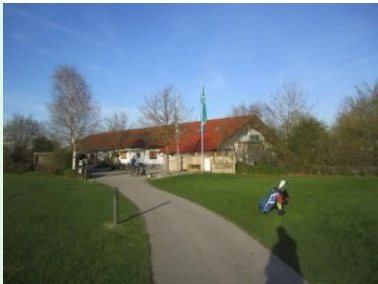
Auf dem Weg zurück zum Clubhaus