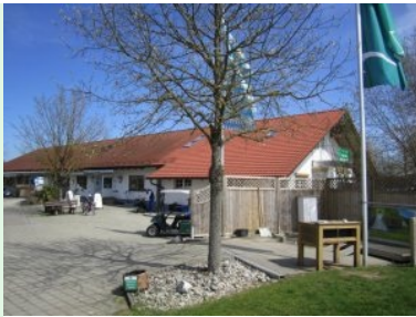
Das Clubhaus der Golfanlage Harthausen bei München