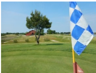
Loch 5 (Par 4, 286m)

verstehen die meisten die deutsche Sprache. Der Weg zum ersten Tee ist zwar mit einem Wegweiser beschildert - aber trotzdem nicht einfach zu finden. Sie sollten nicht am Tee 18 aufs Inselgrün abschlagen - dies ist nämlich der erste Abschlag hinter dem Clubhaus. Meine Flightpartner haben mir erzählt, dass dieses Loch früher das Loch 1 war. Weil aber ein Par 3 mit Inselgrün ein gar untypischer Eröffnungsloch ist hat man das Routing geändert. Man geht also am Tee 18 vorbei (rechter Hand) Richtung Norden zum Tee 1. Ich bin dabei das erste Mal auf eine von mehreren größere Entenkolonie gestoßen die sich hier am Golfplatz rund um die Teiche (es gibt drei große Teiche und mehrere kleinere Gewässer am Platz) aufhalten und leider auch Ihrer Spuren in Form von Exkrementen hinterlassen. Vergessen Sie also am Ende der Runde nicht die Sohlen Ihrer Golfschuhe und die Räder des Trolleys sauber zu waschen damit Ihr Auto sauber bleibt. Der Golfplatz ist komplett flach und wird im Norden (entlang der Löcher 1, 5, 6, 7, 8 von der Lagune begrenzt. Vereinzelt spenden Bäume Schatten, ansonsten liegt der Platz im offenen Gelände.