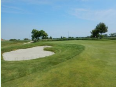
Grün Loch 14