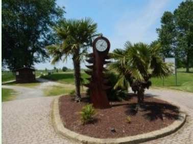
Wieder zurück beim Clubhaus