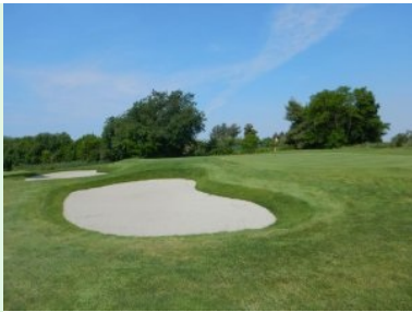
Grün Loch 6