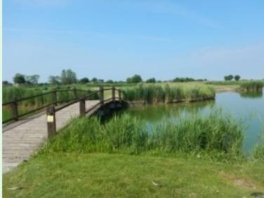
Holzbrücke auf Loch 2