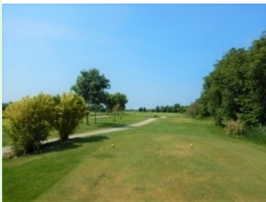
Loch 8 (Par 4, 342m)