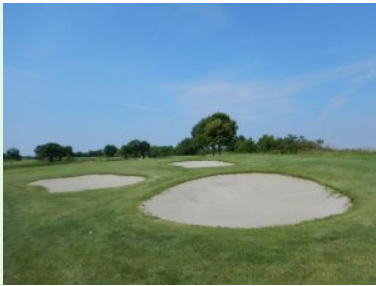
Loch 6 (Par 4, 313m)

daneben eine große Kuppel auf. Es ist dies die kleine Insel Barbana in der Lagune mit dem Franziskanerkloster das jährlich am ersten Sonntag im Juli zum Schauplatz einer Prozession wird. Loch 6 (Par 4, 313m) führt auch entlang der Lagune. Das Fairway ist eng, in der Landezone liegen drei Fairwaybunker auf der rechten Seite, weiter vorne am Grün lauern weitere zwei Sandbunker. Der Abschlag von Loch 7 (Par 3, 134m) erfolgt über einen kleinen Teich der sich entlang der gesamten Spielbahn links erstreckt, auch das Grün liegt direkt am Wasser. Rechts hinter dem Grün liegt ein Sandbunker und wartet auf Teeshots die dem Wasser zu sehr ausweichen. Das Grün von Loch 8 (Par 4, 342m) liegt am westlichen Ende des Platzes. Es folgt mit Loch 9 (Par 5, 481m) eine Spielbahn die entlang des gesamten Fairways rechts von Wasser begrenzt wird - es ist dies der dritte große Teich am Platz.