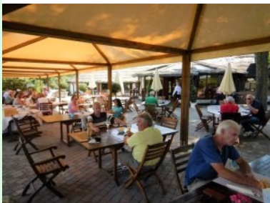
Genießen Sie ein kühles Getränk nach der Runde