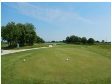
Loch 13 (Par 4, 342m)