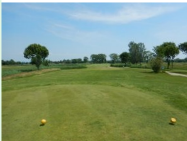
Loch 16 (Par 5, 453m)