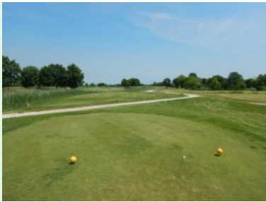
Loch 14 (Par 4, 322m)