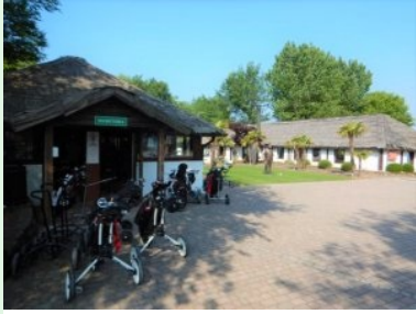
Das Clubhaus des Golf Club Grado