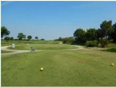
Loch 4 (Par 3, 110m)