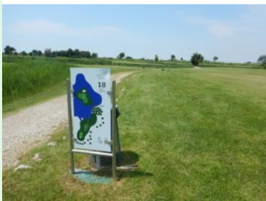
Abschlussloch 18 (Par 3, 166m) mit Inselgrün