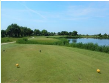
Loch 12 (Par 3, 186m)

Nach Loch 10 (Par 4, 319m) liegt wie schon erwähnt das eher mickrige Halfway House. Loch 11 (Par 5, 499m) ist ein wunderschönes Loch. Das Fairway wird immer enger, das Grün ist ein