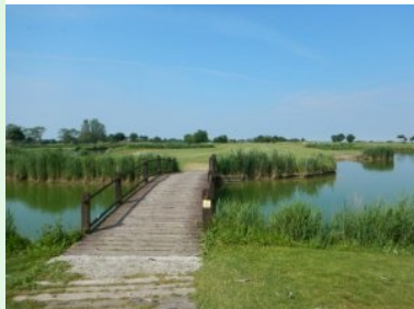
Loch 2 (Par 5, 508m)

verstehen die meisten die deutsche Sprache. Der Weg zum ersten Tee ist zwar mit einem Wegweiser beschildert - aber trotzdem nicht einfach zu finden. Sie sollten nicht am Tee 18 aufs Inselgrün abschlagen - dies ist nämlich der erste Abschlag hinter dem Clubhaus. Meine Flightpartner haben mir erzählt, dass dieses Loch früher das Loch 1 war. Weil aber ein Par 3 mit Inselgrün ein gar untypischer Eröffnungsloch ist hat man das Routing geändert. Man geht also am Tee 18 vorbei (rechter Hand) Richtung Norden zum Tee 1. Ich bin dabei das erste Mal auf eine von mehreren größere Entenkolonie gestoßen die sich hier am Golfplatz rund um die Teiche (es gibt drei große Teiche und mehrere kleinere Gewässer am Platz) aufhalten und leider auch Ihrer Spuren in Form von Exkrementen hinterlassen. Vergessen Sie also am Ende der Runde nicht die Sohlen Ihrer Golfschuhe und die Räder des Trolleys sauber zu waschen damit Ihr Auto sauber bleibt. Der Golfplatz ist komplett flach und wird im Norden (entlang der Löcher 1, 5, 6, 7, 8 von der Lagune begrenzt. Vereinzelt spenden Bäume Schatten, ansonsten liegt der Platz im offenen Gelände.