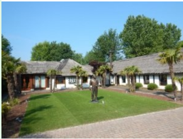
Das Clubhaus des Golf Club Grado