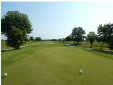
Loch 3 (Par 4, 349m)