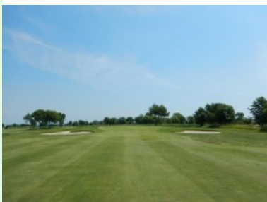
Annäherung Grün Loch 13