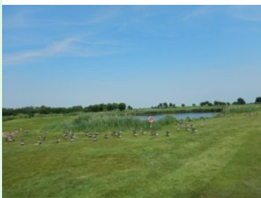
Enten am Fairway von Loch 13