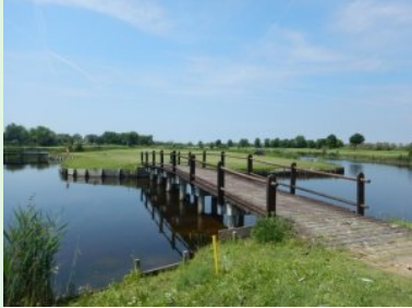
Inselgrün Loch 11 (Par 5, 499m)