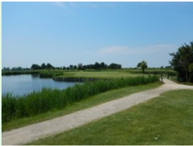
Inselgrün Loch 18