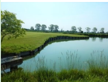
Annäherung Grün Loch 3