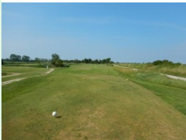
Loch 1 (Par 4, 297m)