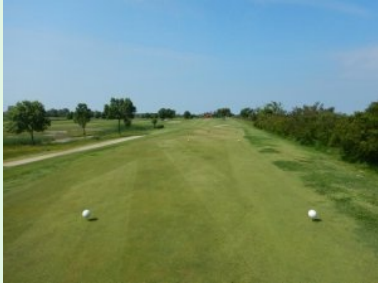
Loch 5 (Par 4, 286m)