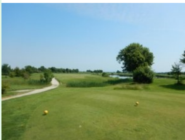
Loch 9 (Par 5, 481m)