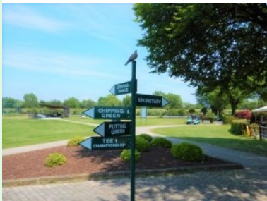
Am Weg zu Tee 1