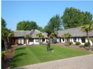
Das Clubhaus des Golf Club Grado

Kilometer führt die Straße vom Festland dann über einen Damm durch die Lagune nach Grado. Grado liegt auf einer Insel (eigentlich ist es eine Halbinsel - mit dem Festland nur durch einen schmalen Landstreifen verbunden) rund 20km Luftlinie westlich von Triest und ca. 20km Luftlinie östlich von Ligniano/Bibione in der Nähe des Mündungsdeltas des Isonzo.