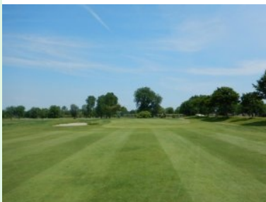
Grün Loch 17 (Par 4, 321m)