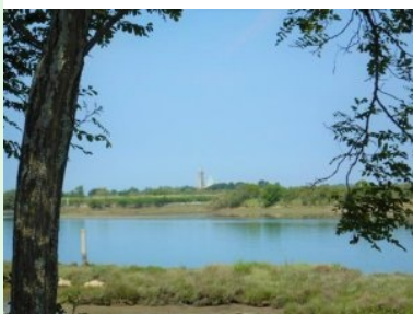
Blick über die Lagune auf die kleine Insel Barbana mit dem Franziskanerkloster