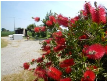
Halfway Station mit wunderschön blühenden Strauch