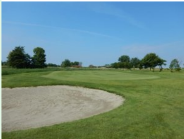
Grün Loch 2