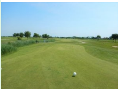
Loch 10 (Par 4, 319m)