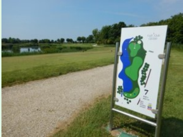
Infotafel an Tee 7