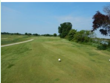
Loch 6 (Par 4, 313m)