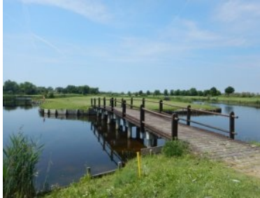
Inselgrün Loch 11 (Par 5, 499m)

110m) das erste Par 3 am Platz. Mit 110m Länge ist das Grün gut zu erreichen, allerdings lauern 4 Grünbunker auf zu kurze Teeshots. Loch 5 (Par 4, 286m) liegt dann wieder an der Lagune am nördlichen Rand des Areals - im Hintergrund sieht man das markante, rotbraun gefärbte alte Haus mit der großen Aufschrift "Golf Club". Es ist nicht das Halfway House aber bietet zumindest ein WC für die Golfer. Das Halfway House folgt dann später nach dem Grün 10, es ist aber nur eine einfache Holzhütte mit einem Tisch und ein paar Sesseln davor. Vom leicht erhöhten Grün von Loch 5 sieht man über die Lagune, am Horizont fällt ein hoher Kirchturm und