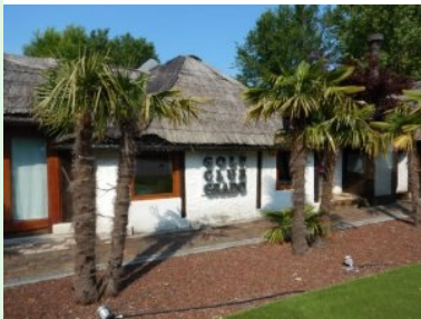
Das Clubhaus des Golf Club Grado