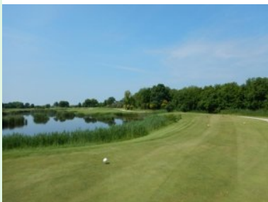
Loch 7 (Par 3, 134m)