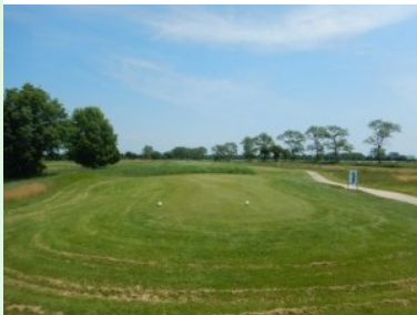
Loch 15 (Par 4, 318m)