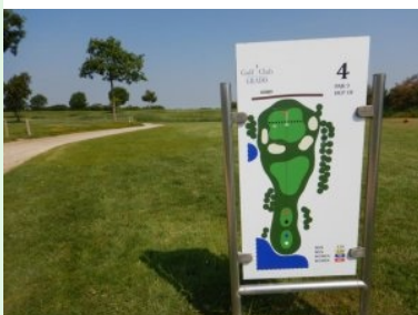
Infotafel am Platz des Golf Club Grado