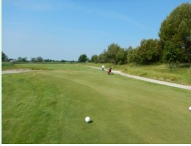
Loch 2 (Par 5, 508m)