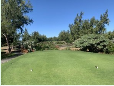
Loch 1 (Par 4, 359m)