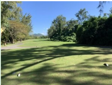
Loch 7 (Par 4, 365m)