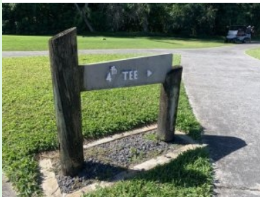
Wegweise am Ile aux Cerfs Golf Course