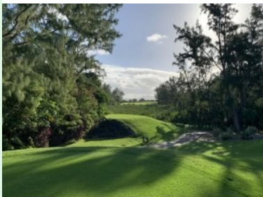
Teeboxen Loch 17 (Par 4, 327m)