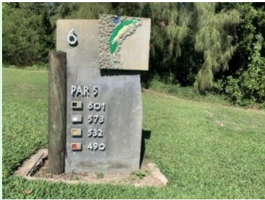
Infotafel am Platz des Ile aux Cerfs Golf Club