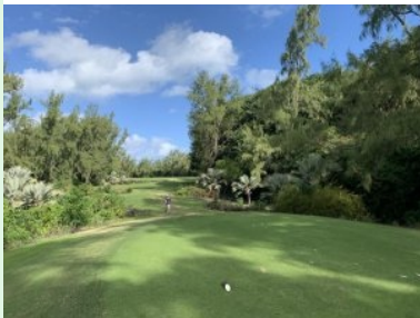
Loch 10 (Par 4, 333m)