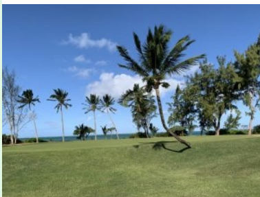
Blick von Tee 13 zurück zu Grün 12