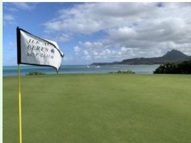
Grün Loch 11 (Par 5, 544m)

Das Clubhaus ist Stroh-gedeckt und nach Süden ausgerichtet, ein großer Shop und das Sekretariat bilden das Zentrum, daneben liegt das Restaurant (Langer's Bar & Grill). Auf einer Seite (im Norden, vom Steg kommend) wird das Clubhaus von Wald begrenzt, Golfplatzseitig (südlich des Clubhauses) liegt etwas unterhalb des Clubhaus-Niveaus das Putting Green und die Drivingsrange.