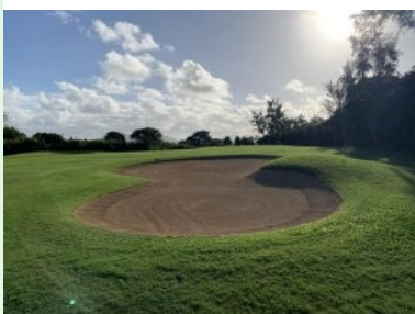
Grün Loch 17