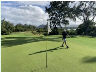
Blick zurück von Grün Loch 14