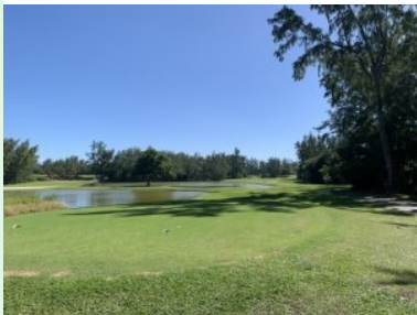
Loch 4 (Par 5, 488m)