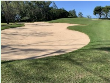
Annäherung Grün Loch 2