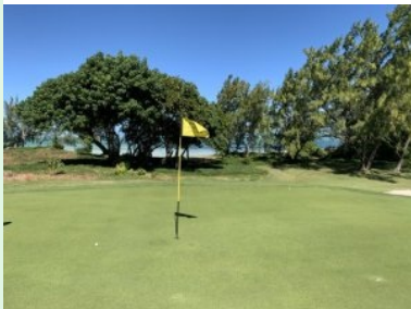
Grün Loch 2 mit dem Indischen Ozean