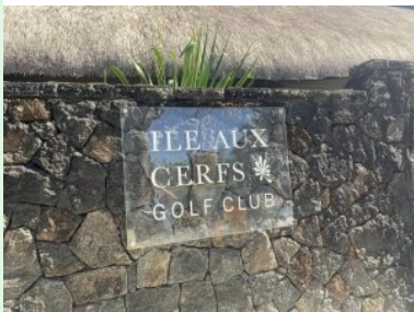
Tafel am Clubhaus des Ile aux Cerfs Golf Club