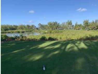
Loch 16 (Par 4, 302m) über einen Seitarm des Indischen Ozeans