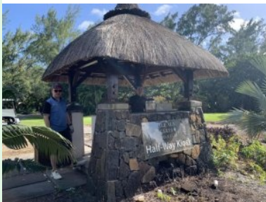
Halfway Kiosk am Ile aux Cerfs Golf Course