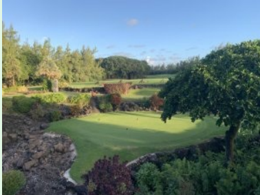
Blick vom Clubhaus hinunter zum Putting Green