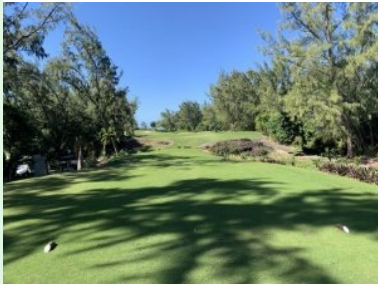
Loch 2 (Par 4, 304m)