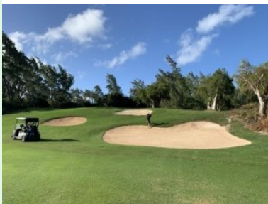
Grün Loch 14