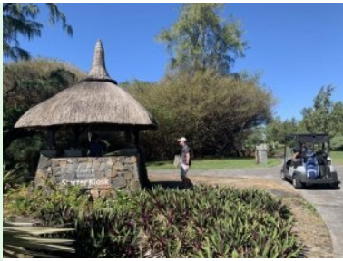
Starter Kiosk am Ile aux Cerfs GC