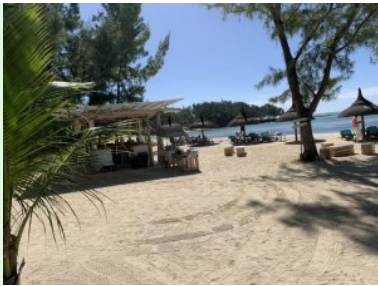
Strand bei Grün 2/Tee 3