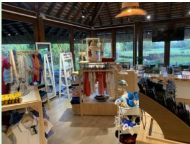
Stöbern im Golfshop