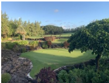
Blick vom Clubhaus übers Putting Green

einen wunderbaren Blick auf den Indischen Ozean. Loch 11 ist das Signature Hole am Platz des Ile aux Cerfs Golf Course . Loch 12 (Par 4, 372m) ist ähnlich wie Loch 11. Von einem erhöhten Abschlag erfolgt der Teeshot über einen großen Sandbunker mit grüner Insel. Links ist entlang der gesamten Spielbahn Strand, lediglich getrennt durch einen schmalen Waldstreifen. Gönnen Sie sich hier einen kurzen Abstecher zum Strand - es zählt sich aus. Grün 12 und der benachbarte Abschlag 13 bilden den südlichsten Punkt der Ile aux Cerfs - ab nun geht es auf der Westseite der Ile aux Cerfs (das ist die Seite die Mauritius zugewandt ist) wieder zurück Richtung Norden zum Clubhaus. Loch 13 (Par 3, 151m) verläuft ebenfalls parallel zum Strand, links vor dem Grün verteidigt ein größerer Teich das Grün, rechts lauert ein Sandbunker. Loch 14 (Par 4, 283m) wartet gleich mit drei Sandbunker vor dem erhöhten Grün auf. Loch 15 (Par 3, 145m) ist