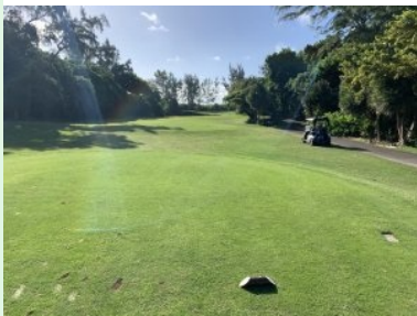
Loch 13 (Par 3, 151m)