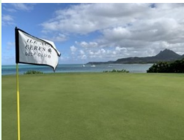
Grün Loch 11