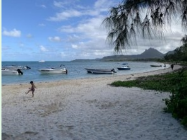
Strand bei Loch 12