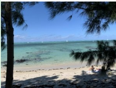
Blick an den Strand