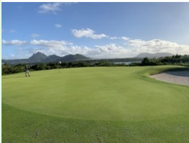
Grün Loch 18 (Par 4, 366m)

Der Abschlag von Loch 10 (Par 4, 333m) ist wunderschön und erfolgt durch eine engere Gasse raus über eine Senke auf ein Fairway das sich nach links wendet. Der Teeshot von Loch 11 (Par 5, 544m) erfolgt ebenfalls von höheren Abschlagboxen über eine Senke. Das Fairway verläuft parallel zum Strand, lediglich durch einen schmalen Baumstreifen getrennt. Vom Fairway hat man einen wunderschönen Blick auf die Berge von Mauritius mit den signifikanten Silhouetten. Das Grün eröffnet