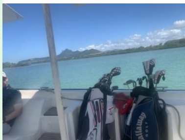
Mit dem Boot zur Ile aux Cerfs (Blick zurück auf Mauritius)