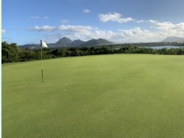
Grün Loch 18