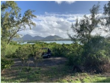
Blick vom Tee 15 über die Lagune Richtung Mauritius