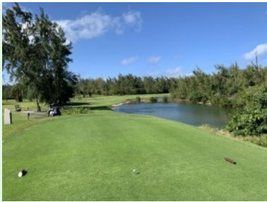
Loch 9 (Par 5, 467m)