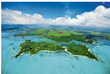
Luftaufnahme des Ile aux Cerfs Golf Course, gegenüber liegt Mauritius mit dem Anahita Golf Course

Kilometer von der Küste entfernt. Die Insel hat eine maximale Ausdehnung von ca. 1,5 x 1 km. Im Wesentlichen besteht die Ile aux Cerfs aus dem Golfplatz und ein paar Strände die öffentlich zugänglich sind. Der Zugang zur Insel erfolgt über ein Bootstransfer, das Boot legt von einem kleinen Bootsteg südlich des 5 Sterne Luxus Resort Shangri-La Le Touessrok ab. Rund zehn Minuten (inkl. eines Zwischenstopps) dauert die Bootsfahrt über die Ile aux Cerfs Lagune bis zum Steg auf der Insel Ile aux Cerfs , hier wird man mit einem Clubcar (Golfshuttle) abgeholt. Vom Steg sind es noch ca. 300m zum Clubhaus des Golfplatzes das im Inneren der Insel liegt. Am Weg zum Clubhaus sieht man das erste Mal einen kleinen Ausschnitt des Golfplatzes (Abschlag Loch 9). Die Überfahrt von Mauritius auf die Insel Ile aux Cerfs (Bootstransfer) und der Transport zum Clubhaus sind in der Greenfee inkludiert.