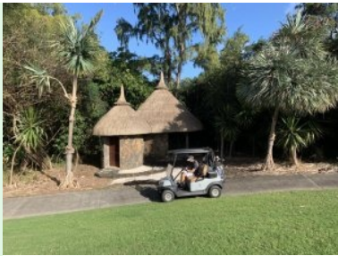
Strohgedeckte WC Häuschen bei Tee 14