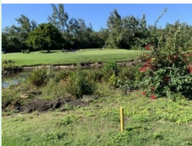
Grün Loch 5