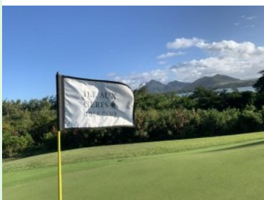
Blick von Grün 17 Richtung Mauritius