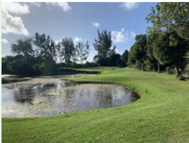
Grün Loch 13