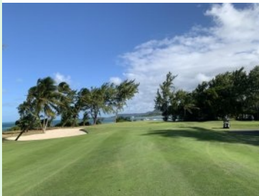
Grün Loch 12