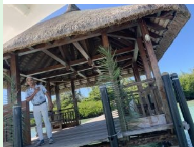
Willkommen am Bootssteg der Ile aux Cerf