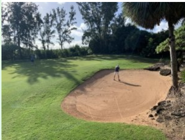
Grün Loch 13