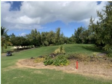
Grün Loch 10