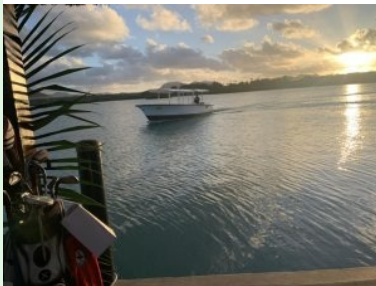
Bootstransfer zurück nach Mauritius

schmal und wird rechts von Wald begrenzt, ausnahmsweise gibt es kein Wasserhindernis und keinen Sandbunker auf der Spielbahn. Loch 16 (Par 4, 302m) ist ein schweres Loch weil Sie einen sehr langen Teeshot brauchen um über den tiefergelegenen Mangrovenwald bzw. dem Seitenarm des indischen Ozeans zu kommen. Von den weißen Teeboxen sind ca. 150m carry notwendig, von den hinteren, schwarzen Championship Abschlägen sind es sogar ca. 180m. Für alle Golfer die sich die Längen nicht zutrauen gibt es weiter vorne noch ein dritte Abschlagbox (gelb). Loch 17 (Par 4, 327m) erfordert auch wieder einen langen Teeshot (mind. 150m von weiß) über einen Mangrovenwald, auch hier gibts wieder eine Möglichkeit von weiter vorne von der gelben Teebox abzuschlagen. Die Landezone ist recht eng und von Wald begrenzt, zwei Sandbunker erschweren die Annäherung an das Grün. Vom