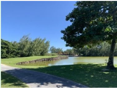
Annäherung Grün Loch 4