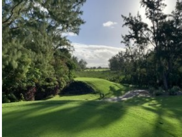
Loch 17 (Par 4, 327m) mit der Landezone ganz hinten

zweigeteilten Teich, der Teeshot erfolgt über das Wasser. Das Grün wird links, rechts und hinten hart von Wasser begrenzt, lediglich vor dem Grün gibt es eine kleine Vorgrünzone die ein wenig Spielraum beim Teeshot erlaubt. Der Teeshot von Loch 4 (Par 4, 488m) erfolgt entlang des großen Teichs bzw. teilweise über den Teich. Der Teeshot von Loch 5 (Par 4, 334m) erfolgt wieder übers Wasser, weiter vorne vor dem Grün quert ein Seitenarm eines weiteren Teichs von rechts kommend das Fairway. Loch 6 (Par 5, 573m) ist allein schon wegen der Länge eine Herausforderung. Das Fairway bildet ein Dogleg nach rechts, die gesamte Spielbahn verläuft parallel zum Strand der nur durch einen schmalen Waldstreifen vom Fairway getrennt ist. Loch 7 (Par 4, 365m) biegt rechts um einen Wald, das Grün wird links und rechts von Sandbunker bewacht. Der Teeshot von Loch 8 (Par 3, 126m) erfolgt von einer erhöhten Abschlagbox auf ein erhöhtes Grün. Der