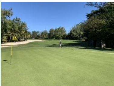
Blick zurück von Grün Loch 6