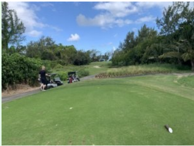
Loch 11 (Par 5, 544m)