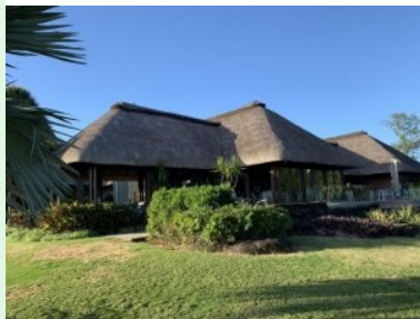
Das Clubhaus des Ile aux Cerfs Golf Club

Ein wunderschöner, spektakulärer und schwerer Golfplatz auf der kleinen tropischen Insel Ile aux Cerfs vor der Küste Mauritius gelegen und designt von Bernhard Langer