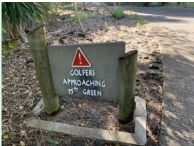
Hinweistafel bei Tee 15 am Ile aux Cerfs Golf Course