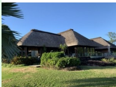
Das Clubhaus des Ile aux Cerfs Golf Club