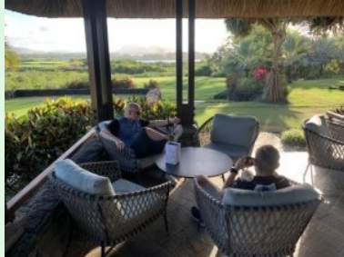
Auf der Clubhaus Terrasse