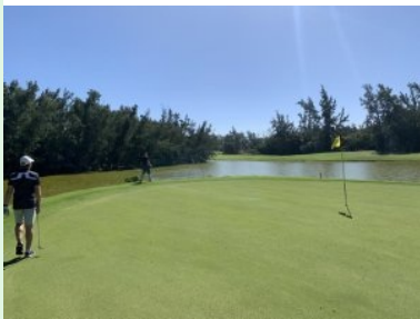
Grün Loch 3