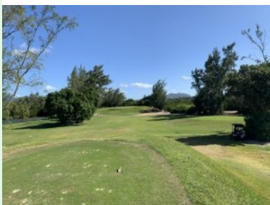
Loch 8 (Par 3, 126m)