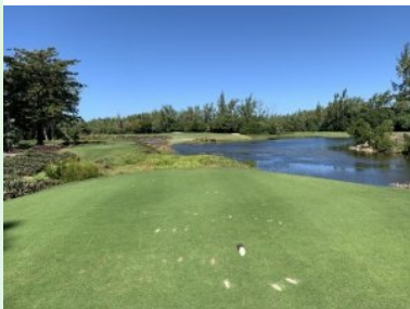
Loch 5 (Par 4, 334m)