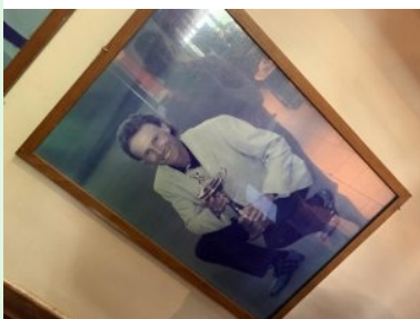
Platzdesign von Bernhard Langer