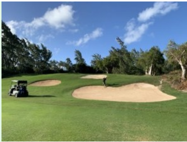
Grün Loch 14 (Par 4, 283m)

Abschlag von Loch 9 (Par 5, 457m) liegt unweit des Bootsstegs. Die Spielbahn bildet einen Halbkreis nach rechts um zwei Teiche. Entlang der gesamten Spielbahn ist rechts Wasser, der Annäherungsschlag aufs Grün erfolgt über den Teich. Nach einem kurzen Zwischenstopp am Halfway Kiosk gehts weiter auf die Back-Nine.