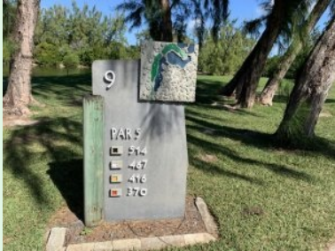
Infotafel am Platz des Ile aux Cerfs Golf Club