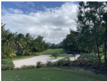
Loch 12 (Par 4, 372m)

diesmal allerdings ohne große notwendige Länge. Das leicht ondulierte Grün wird links von einem riesengroßen Sandbunker verteidigt. Im Bereich Grün 2/Tee3 gibt es ein strohgedecktes WC Häuschen, man befindet sich hier im südöstlichen Teil der Insel. Hier lohnt sich auch ein kleiner Abstecher zum benachbarten Strand, der lediglich durch einen schmalen Waldstreifen vom Golfplatz getrennt ist. Folgen Sie einfach dem Grillgeruch und der Musik die vom Strand kommen. Loch 3 (Par 3, 140m) ist ein schweres Loch, sowohl die Teeboxen als auch das Halbinselgrün liegen an einem großen