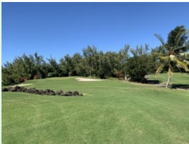
Grün Loch 1