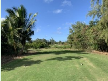
Loch 14 (Par 4, 283m)