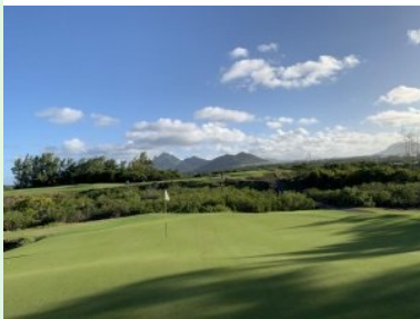
Blick vom Reservegrün (19. Grün) zurück Richtung Mauritius