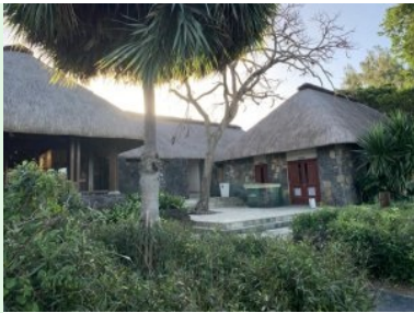
Das Clubhaus des Ile aux Cerfs Golf Club