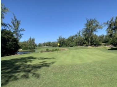
Blick zurück von Grün 4