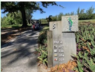
Infotafel am Platz des Ile aux Cerfs Golf Club