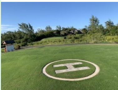
Helipad mit Reservegrün im Hintergrund