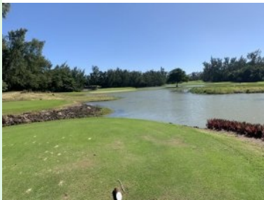
Loch 3 (Par 3, 140m)