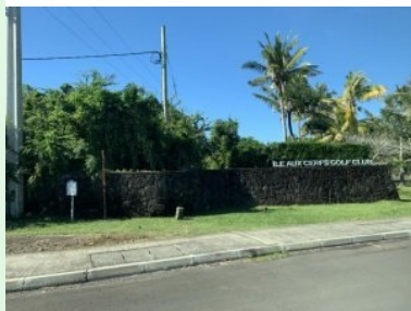
Wegweiser zur Ile aux Cerfs GC auf Mauritius