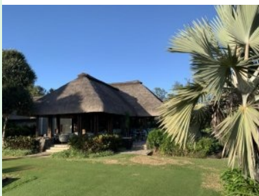
Wieder zurück beim Clubhaus