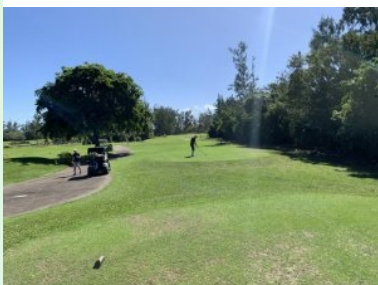
Loch 6 (Par 5, 573m)