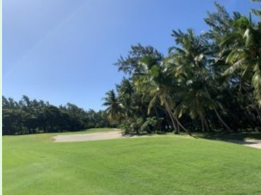
Annäherung Grün Loch 6