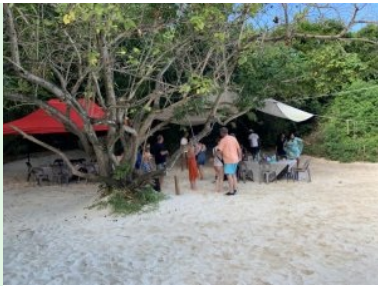
Gesellige Runde am Strand der Ile aux Cerfs