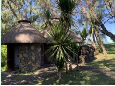
Strohgedeckte WC Häuschen bei Tee 3