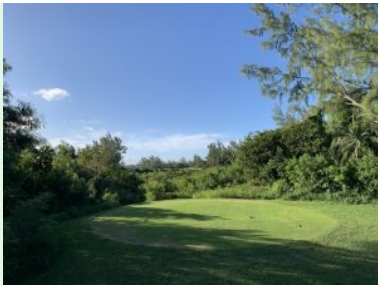
Loch 18 (Par 4, 366m)