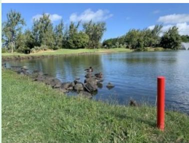
Annäherung Grün Loch 9