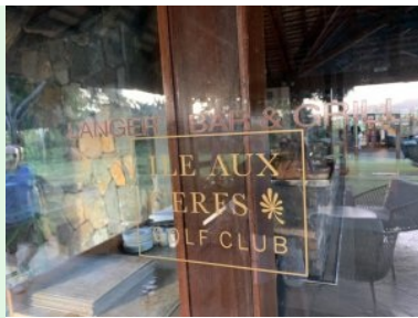
Langer's Bar & Grill