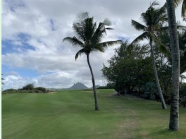
Blick von Loch 11 Richtung Berge auf Mauritius