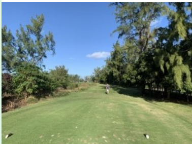
Loch 15 (Par 3, 145m)