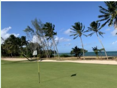
Blick zurück von Grün Loch 12