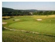
Grün und Fairway Loch 8, dahinter Breitenfurt