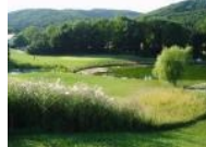
Blick vom Tee 8 hinunter zu den Grüns 7 (vorne) und 9 (hinten)

Szene rund um Wien, weil es sich um einen vollwertigen 9-Loch Platz handelt. Die Länge einer 18 Loch Runde vom gelben Abschlag beträgt 5.188m. Sehr zu empfehlen ist der Platz auch für eine Runde nach der Arbeit, weil er quasi am Stadtrand liegt und deshalb die Anfahrtszeit kurz ist.