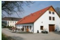
GC Breitenfurt Clubhaus

Breitenfurt liegt südwestlich von Wien am Rande des Wienerwaldes. Die Zufahrt erfolgt von Wien kommend über Wien-Liesing/Kalksburg. Der Golfplatz befindet sich am Ortsende von Breitenfurt auf der linken Seite, die Zufahrt ist gut beschildert. Das Clubhaus ist in der ehemaligen Scheune des Klosters St.Josef untergebracht. Wenn man vom Clubhaus zur Driving Range geht, dann passiert man direkt das Kloster. Was sich die Nonnen wohl denken, wenn ständig Golfer ihre Wege kreuzen ?