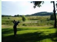
Abschlag und Grün Loch 7 (Par 3)

Zum schönsten Loch wähle ich ex aequo die beiden Par 3 von Loch 5 und Loch 7. Der Abschlag von Loch 5 (Par 3, 151m) liegt am höchsten Punkt des gesamten Golfplatzes, das Grün liegt tief unterhalb des Abschlagboxen. Wenn der Abschlag zu lange ist, dann rollt der Ball unweigerlich Richtung Wald oder er landet im Sandbunker. Das gesamte Loch ist durch einen Waldstreifen vom restlichen Platz räumlich getrennt. Loch 7 (Par 3, 116m) befindet sich am tiefsten Punkt des Platzes und ist flach. Vom Abschlag aus muss über einen Teich aufs Grün gespielt werden.