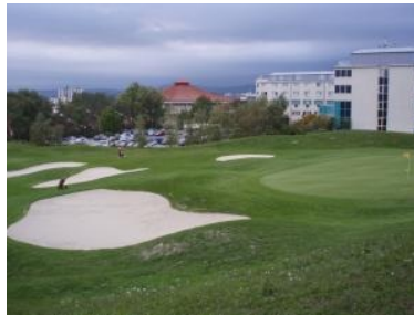
Das Finale: Grün 9 mit Hotel Bosei und dem Bodocenter im Hintergrund