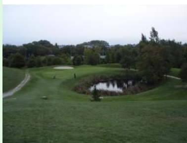
Signaturehole Loch 8 (Par 3)