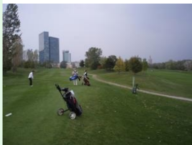
Loch 4 (Par 4, 389m) bergauf

Südostringtangente sind sie schnell dort. Als 9-Loch Platz eignet sich die Anlage am Wienerberg ideal für die Runde nach dem Büro - gerade jetzt im Herbst, wenn es schon früher finster wird und jede Minute kostbare Zeit ist.