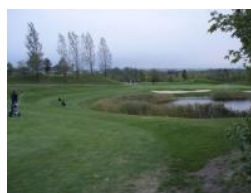
Annäherung Grün 7 (Par 4)

teilen, die hier ebenfalls ihr zu Hause gefunden haben. Ungewöhnlich ist weiters, dass man mit dem Trolley durch das Clubhaus durchfahren muss, weil es aussen keinen Weg zwischen Parkplatz und Golfplatz gibt. Bitte nehmen sie mit dem Trolley aber bitte nicht die Abkürzung geradeaus durch das Clubrestaurant auf die Terrasse zum Tee 1 sondern nehmen sie den seitlichen Ausgang rechts im Clubhaus. Eine weitere Novität - aber eine gute Idee - ist das Bezahlen nach der Runde und das vorherige Einbehalten der ÖGV Karte quasi als Pfand. Wenn man es sich kurzfristig überlegt und zwei Mal die 9-Loch Runde geht ist das also auch kein Problem.