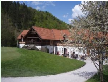
Das Clubhouse mit Terrasse

Mai 2008 - Der Platz des Golfclub Adamstal ist eine Perle im niederösterreichischen Voralpengebiet. Sowohl spielerisch als auch landschaftlich braucht der Platz von ÖGV Präsident und Ex-Rallye Staatsmeister Franz Wittmann den Vergleich mit anderen Premium Golfplätzen im In- und Ausland nicht zu scheuen. Adamstal ist jährlich Veranstaltungsort eines Challenge Tour Turniers. Die Challenge Tour ist die zweithöchste Golf-Profi-Turnierserie in Europa.