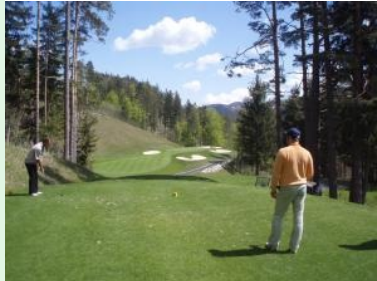
Loch 16 "R1 Kehre" (Par 3)

beim Challenge Tour Event ? Erwähnenswert ist auch, dass der Platz aufgrund seiner exponierten Lage in einem Gebirgstal sehr anfällig für Regen ist - deshalb bitte unbedingt Regenschutz auf die Runde mitnehmen. Wenn sie allerdings das Glück haben Adamstal bei Schönwetter zu spielen dann erleben sie das niederösterreichische Voralpengebiet von seiner schönsten Seite.