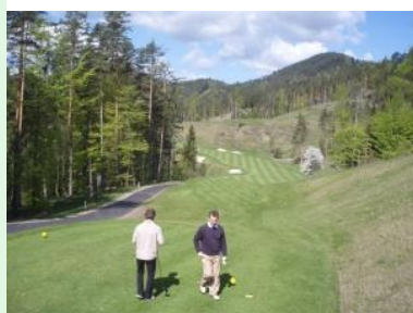
Loch 7 "Meinl Villa" (Par 5)

von Loch 4 am höchsten Punkt des Kurses, jetzt geht nochmals bergauf. Loch 5 (" Zur Felsenwand ") führt zum ersten Par 3 des neuen Championship Kurses, der sogenannten Wolfstränke . Das Grün des bergab führenden Par 3 wird links von einem Teich verteidigt. Das Par 5 Loch 7 (" Meinl Villa ") führt direkt oberhalb der Meinl Villa vorbei, die jetzt als Haupthaus der Country Lodge Adamstal fungiert. Falls sie ein paar hunderttausend Euro in eine Wohnung in absoluter Grünruhelage investieren wollen sind sie hier richtig - sie könnten sich dann auch damit rühmen, dass Markus Brier einer ihrer Nachbarn ist. Nach dem Loch 9 gibt es die neue Halfway Station.