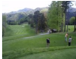
Loch 11 "Hausbergkante"

Nach der Runde kann man gemütlich im Clubhaus das gute Essen genießen ehe man die lange Heimreise (nach Wien) antritt. Womit ich bei den Nachteilen des Platzes wäre: Einerseits die Entfernung von Wien mit einer guten Stunde Fahrzeit mit dem Auto - es gibt allerdings Übernachtungsmöglichkeiten in Adamstal. Ein weiteres Manko erscheint mir die doch sehr kleine Driving Range zu sein. Mehr als maximal 10 Personen können da nicht trainieren. Wie löst man das Problem