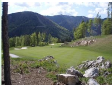
Loch 5 "Zur Felsenwand" (Par 4)

Das erste Loch startet hinter dem Clubhaus - es ist ein flaches Par 4 und gut geeignet zum Aufwärmen. Dann geht es über die Straße, bei Loch 2 mit dem Namen Felsenhöhe lässt der Platz das erste mal die Muskeln spielen - das Fairway führt steil bergauf. In dieser Tonart geht es dann weiter. Die Löcher mit den klingenden Namen Stiftswiese und Hausberg führen weiter bergauf. Die Fairways sind teilweise sehr eng und von Wald umzingelt. Wenn man den Teeshot verhaut, gibt es kaum Hoffnung, den Ball wieder zu finden. Es gibt auch keine banachbarten Fairways, die man treffen könnte und so vielleicht das Weiterspielen ermöglichen. Mit den Löchern 5 bis 10 folgen dann sechs neue Löcher. Beim alten Kurs war das Grün