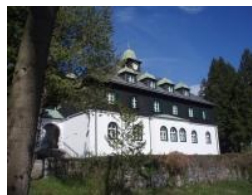
Die Meinl Villa als Country-Lodge

Championship Course eröffnet, dieser liegt mit Ausnahme des ersten Loches rechts der Straße. Der Course Wallerbach ist ein 9-Loch Platz, er liegt links der Straße und ist identisch mit den Back-Nine der alten Kurses.