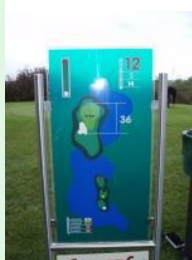
Infotafel in Donnerskirchen

Eingebettet in die wunderschöne Landschaft zwischen dem Neusiedlersee und dem Leithagebirge befindet sich der 1990 eröffnete 18-Loch Championship Platz des Golfclubs Neusiedlersee-Donnerskirchen. Das milde pannonische Klima erlaubt meistens sogar ein Durchspielen im Winter. Der flache Kurs, der Ähnlichkeiten mit schottischen Links-Courses hat, bietet einige auch für das Auge hochinteressante Spielbahnen und ist jedenfalls einen Ausflug wert.