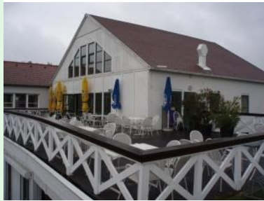
Das Clubhaus des GC Neusiedlersee-Donnerskirchen

Oktober 2008 - Der Platz des Golfclubs Neusiedlersee-Donnerskirchen liegt an der Westseite des Neusiedlersees in Donnerskirchen im Burgenland. Von Wien kommend erreichen sie den Platz am besten, wenn sie die Autobahn bis zum Raum Eisenstadt (zuerst die Süd- und dann die Südostautobahn, dann die Burgenland-Schnellstraße Richtung Norden) fahren und dann noch ca. 15 km Richtung Norden bis Donnerskirchen.