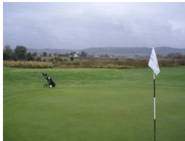
Blick auf Donnerskirchen und das Leithagebirge

Das Clubhaus des Golfclubs Neusiedlersee-Donnerskirchen fällt unter die Kategorie Durchschnitt, es ist zweckdienlich eingerichtet. Gleich beim Eingang links das Clubsekretariat mit sehr freundlicher Bedienung, mit integriertem Golfshop und dahinter dann das Restaurant. Die Speisekarte im Restaurant kann sich durchaus sehen lassen. Und passend zur Gegend findet sich auch der eine oder andere Wein in der Karte. Der Golfclub gehört - ebenso wie der GC Süßenbrunn im Norden von Wien - zu den Club Danube Freizeitanlagen.