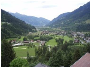
Blick hinunter von Bad Gastein auf den alten Teil des Golfplatzes (Back-Nine)

Die Dame vom Sekretariat sitzt nicht im Clubhaus sondern in dem kleinen Starterhäuschen daneben. Dann die große Überraschung: Tee 1 ist nicht die Abschlagbox gleich daneben (es ist dies Tee 10) - nein, Tee 1 liegt ca. 10 min zu Fuß entfernt. Man geht über die Brücke der Gasteiner Ache und dann entlang der Achenpromenade. Das Rauschen des Gebirgsbaches habe ich als sehr angenehm in Erinnerung, ab diesem Zeitpunkt taucht man ein in die scheinbar heile Idylle des Gasteiner Tals. Richtung talauwärts geht's vorbei an einem Reitstall und kurz dahinter liegt dann auch schon Tee 1 mit der eigentlichen Starthütte. Das Eröffnungsloch ist ein leichtes, unscheinbares Par 3 (134m von gelb), danach geht's durch ein kleines Wäldchen zu Loch 2. Ab jetzt spielt man