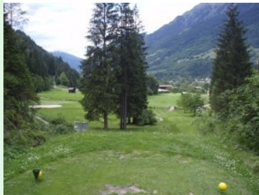
Blick vom Adlerhorst-ähnlichen Tee 14 hinunter zum Grün (rechts, vor dem Stallgebäude); links Grün 13

der ältesten in Österreich - der Golfclub wurde 1960 gegründet. Im Winter führt eine Langlaufloipe über die Golfanlage. Ein absolut empfehlenswerter Platz, den sie unbedingt spielen sollten!