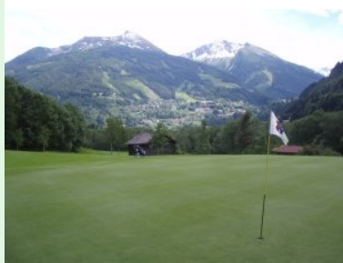
Blick von den Front-Nine zurück nach Bad Gastein

auf einem leicht hügeligen Gelände im schmalen Gasteinertal auf offenem Gelände Richtung talauwärts. In Erinnerung geblieben ist mir Loch 3 (Par 5, 482m von gelb), dessen tiefer liegendes Grün nach einem Dogleg links wunderschön an einem Waldrand liegt. Tee 5 ist der höchste Punkt der Front-Nine, das Par 4 (292m von gelb) führt bergab, in der Landezone steht ein Baum. Loch 6 (Par 3, 177m) ist das am weitesten vom Clubhaus entfernte Loch. Achten sie hier besonders auf das dichte, hohe Rough auf der linken Seite vor dem Grün ! Loch 8 (Par 5, 487m) hat mich total abgeworfen. Zuerst erwartet einem eine schmale Landezone mit Wald bzw. dichtem Rough links und rechts, danach kommen auch noch ein Biotop und ein querender Bach ins Spiel. Dieses Loch hat aus meiner Sicht zu Recht Hcp 1 - damit ist es auch offiziell das schwerste Loch am Platz. Nach Loch 9 geht es wieder - parallel zur Gasteiner Ache - zurück zum Clubhaus. Genießen sie jetzt bitte wieder das wildromantische Rauschen der Gasteiner Ache.