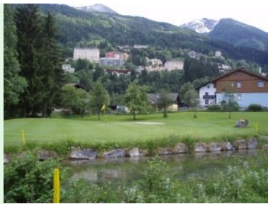
Forellenteich vor Tee 11 (Par4, 231m) vor der Kulisse von Bad Gastein

das Signature-Hole in Bad Gastein. Danach führt der Golfplatz vorbei an Bauernhöfen und Wohnhäusern. Loch 15 bringt sie wieder zurück in den Bereich vor dem Clubhaus. Loch 16, 17 und 18 bilden dann noch eine Schleife vor der Clubhausterrasse.