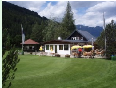
Herzlich willkommen im GC Bad Gastein !

bergab. Umgeben wird das Gasteinertal von der wunderbaren Bergkulisse der Hohen Tauern mit ihren schneebedeckten Gipfeln.