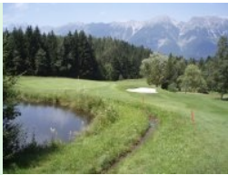
Annäherung Grün Loch 13

Rund zehn Kilometer oberhalb von Innsbruck liegt der 18-Loch Platz des Golfclubs Innsbruck-Igls in Rinn auf einem Hochplateau südlich des Inntals mit herrlichem Ausblick auf die Nordkette.