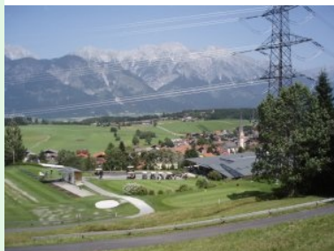
Blick von Tee 11 über das Clubhaus hinunter nach Rinn

ein steil bergauf führendes Par 3 - hier dürfen sie nicht zu lang sein sonst landet ihr Ball direkt im Clubhaus hinter dem Grün 18.