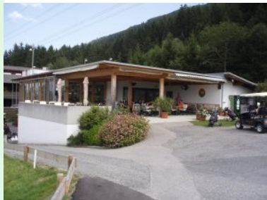
Herzlich willkommen im Golfclub Innsbruck-Igls in Rinn

Ein anspruchsvoller Golfplatz mit Aussicht hoch oberhalb von Innsbruck