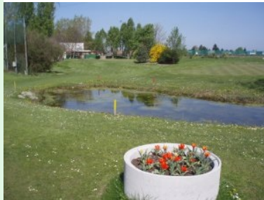
Der Teich im Dogleg von Loch 1 (Par 4, 140m)

Im Sportcenter Marco Polo angekommen fällt gleich mal auf, dass der Parkplatz - lediglich durch einen Radweg getrennt - direkt an der Ruthnergasse liegt. Passen sie also bitte auf, dass sie beim Ausladen ihres Bags aus den Kofferraum keinen Radfahrer zu Sturz bringen bzw. umgekehrt dass sie nicht von einem Radfahrer gerammt werden.