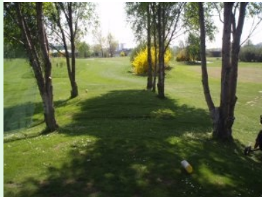
Abschlag Loch 2 (Par 3, 104m von gelb)

Die Reihenfolge der Spielbahnen - so wie ich sie im April 2009 vorgefunden habe - entspricht leider nicht der Reihenfolge des Plans auf der Homepage des Golfclubs. Loch 1, 6, 7 (im Plan Loch 9, 3, 4) sind sogar anders zusammengesetzt.