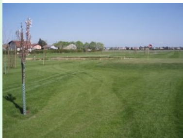
Blick zurück von Fairway Loch 7, im Hintergrund der zweite Teich (im neuen Teil des Platzes)

Im Norden von Wien - im Bezirk Floridsdorf - liegt die 9-Loch Kompaktanlage des Club Marco Polo. Sechs kurze Par 3 Löcher mit rund 100m und drei längere Par 4 Löcher mit ca. 200 - 350m lassen einem vor allem das Kurzspiel üben. Obwohl ein Par 60 Kompaktplatz ist der Platz nicht ganz so leicht wie man das vermuten könnte - ich habe während meiner Golfrunde mehrere Bälle verschossen. Für eine Runde nach dem Büro oder für Golfeinsteiger ist der Platz gut geeignet. Der Platz hat auch ein Course-Rating und der Club ist offizielles Mitglied des Österreichischen Golfverbandes. Eine Drivingrange wird gerade fertig gebaut.