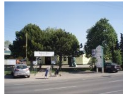
Marco Polo in Wien Floridsdorf

April 2009 - Im Norden von Wien in der Ruthnergasse 170 in Wien 21 (Floridsdorf) - Zufahrt von der City kommend über die Siemensstraße oder Shuttleworthstraße - gibt es neuerdings einen 9-Loch Kompaktplatz, der sich durchaus für eine schnelle Runde nach dem Büro eignet.