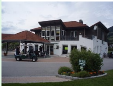
Herzlich Willkommen im Golfclub Mittersill !

Ein schöner aber wenig aufregender Golfplatz im Salzburger Pinzgau