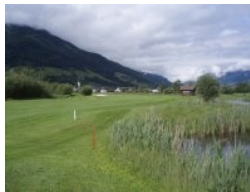
Loch 6 (Par 5) mit der Kirche von Mittersill im Hintergrund

liegen westlich vom Clubhaus (Richtung Mittersill), die Back-Nine verlaufen östlich des Clubhauses. Durch die gesamte Golfanlage schlängelt sich ein kleiner Bach, der fast an jedem Loch ins Spiel kommt. Auch gibt es mehrere Teiche, die einerseits golferisch eine Herausforderung sind und andererseits der Optik des Platzes gut tun. Insbesondere erwähnenswert ist der Teich hinter dem Clubhaus direkt neben Grün 9 und Grün 18 (Inselgrün).