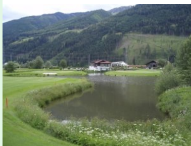
Loch 18 (Par 3, 137m) mit Inselgrün

Der 18-Loch Platz des Golf Club Mittersill liegt in der Talsohle der Salzach und ist von der wunderschönen Bergkulisse des Salzburger Pinzgaus umgeben. Der vollkommen flache Platz ist in einem guten Zustand und kann durch Heustadln, Teichen, Waste Areas und vielen Sandbunkern mit genügend golferischen und optischen Goodies aufwarten. Trotzdem geht mir beim Platz irgendetwas ab - das absolute Highlight, das gewisse Etwas, an das man sich auch noch nach Jahren erinnern kann - der Platz in Mittersill ist schön und spielenswert - aber er ist mir ein bisschen zu brav !