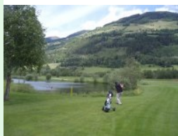
Loch 14 (Par 4, 354m)

In Erinnerung geblieben ist mir von den Front-Nine Loch 8 (Par 5, 494 m von gelb), weil genau in der Landezone des Abschlags zwei Heustadeln stehen und Loch 9 (Par 4, 310 m) mit einem Halbinselgrün beim Clubhaus. Das Grün ist zweistufig und wird neben dem Teich auch noch von einem Sandbunker verteidigt. Von den Back-Nine stechen hervor Loch 14 (Par 4, 354 m),