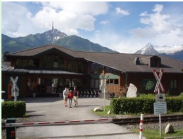
Herzlich willkommen im GC Zell am See Kaprun. Vorsicht: Zug quert !

Ein perfekt gepflegter Golfplatz mit herrlicher Naturkulisse