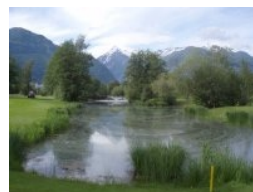
Teich an Grün 6, rechts Grün 1

"Schmittenhöhe" entschieden. Vorbei geht's am Starterhäuschen zum ersten Tee. Der Kurs "Schmittenhöhe" liegt auf der linken (östlichen) Seite der Anlage. Es ist ein wunderschöner Tag hier im Salzachtal - der schneebedeckte Gipfel des Kitzsteinhorns (3.203 m) ist ständiger Begleiter auf der Runde. Der Kurs ist komplett flach, ich würde ihn als Parklandkurs einstufen. Mehrere größere und kleinere Teiche und etliche Holzhütten lockern das relativ monotone Dahinspielen