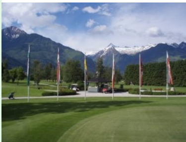
Das Starterhaus mit dem Kitzsteinhorn (3.203m) im Hintergrund

etwas auf. Loch 1 (Par 5, 499m von gelb) ist das doch schon recht lange Eröffnungsloch, hinter dem Grün lauert ein Teich auf die Bälle. Loch 2 ist dann ein besonders langes Par 3 (212m von gelb), der Teeshot geht übers Wasser, das aber nicht wirklich ins Spiel kommen sollte. Loch 4 (Par 4, 329m) ist das vom Clubhaus am weitesten entfernte Loch. Loch 11 (Par 4, 293m von gelb) ist ein Dogleg rechts, bei dem genau im Knie eine Holzhütte steht, die einem das Leben schwer machen kann. Loch 15 ist ein quer zu den anderen Spielbahnen liegendes Par 3 (164m). Loch 16 ist ein 90-Grad Dogleg rechts Par 4 (349m), das entlang des östlichen Randes der Golfanlage liegt. Tee 17 (Par 4, 355m) liegt direkt neben einer Reihenhaussiedlung, mit dem zweiten Schlag geht's über einen Teich. Loch 18 (Par 5, 518m) führt zum Clubhaus zurück, das Grün wird von einem frontalem Wasserhindernis verteidigt. Keines der Löcher drängt sich mir als Signature Hole auf. Erwähnenswert ist auch noch die Tatsache, dass man nach den Front-Nine nicht zum Clubhaus zurückkommt.