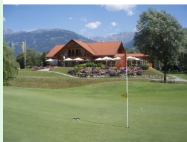
Grün 9 (roter Kurs) mit dem Restaurant

Der blaue Platz beginnt ebenfalls recht gemütlich mit Loch 1 (Par 4, 334m). Auf Loch 2 (Par 3, 147m) kommt das erste Mal Wasser ins Spiel des blauen Platzes. Gut in Erinnerung habe ich Loch 4 (Par 5, 463m), weil das Fairway zweigeteilt ist. Entweder Sie spielen links über das Wasser die direkte Linie oder - etwas weniger riskant - rechts das Parallelfairway und mit dem nächsten Schlag dann weiter zum eigentlichen Fairway. Loch 6 (Par 3, 149m) habe ich auch noch bestens in Erinnerung: links vor dem Grün lauert ein Teich, der so klar ist dass man den Boden sieht und auch alle Golfbälle die im Wasser liegen - und glauben Sie mir: das sind ganz schön viele. Eine Enten-Mami mit ihren vier Küken lebt an diesem Teich - ein Zeichen