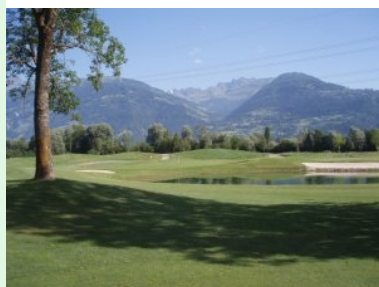
Wasser am Grün von Loch 3 (roter Kurs)

Dolomitengolf steht direkt an der Anlage. Insgesamt stehen drei 9 Loch-Plätze (jeweils Par 36) zur Verfügung (rot, blau, grün) - tageweise werden zwei der drei Plätze zu einem 18-Loch Platz "kombiniert". Ich habe rot-blau gespielt. Alle drei 9-Loch Plätze liegen südöstlich vom Clubhaus, wobei der rote Platz die innere Schleife bildet, der grüne Platz die mittlere Schleife und der blaue Platz die äußerste Schleife.