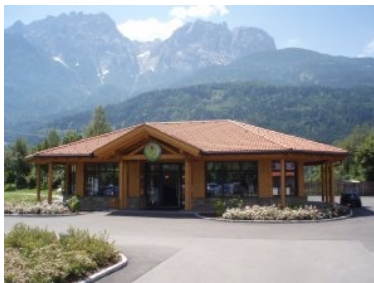
Der Empfangspavillon des GC Dolomitengolf

Juli 2010 - Rund fünf Kilometer südöstlich der Sonnenstadt Lienz - in der Gemeinde Lavant - liegt der 27-Loch Platz des Golfclubs Dolomitengolf Osttirol. Der Golfplatz ist von der Abzweigung von der Bundesstraße zwischen Lienz und Spittal an der Drau beschildert. Nach der Überquerung der Drau erreichen Sie schnell die Anlage des Golfclubs Dolomitengolf.