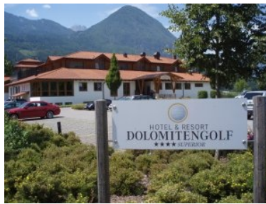
***Hotel Dolomiten golf direkt am Platz