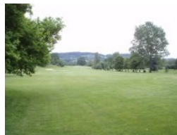
Loch 1 (Par 5, 493m)

Loch 5 (Par 4, 326m) ist ein schönes Dogleg links. Wenn Sie lang vom Abschlag sind können Sie hier die direkte Linie wählen und damit das Knie abkürzen. Außerhalb von Loch 5 befindet sich der zusätzliche 9-Loch Platz, der zur Anlage in Moosburg gehört. Hier gibt es auch eine zweite Drivingrange. Weiter geht's am 18-Loch Platz mit Loch 6 (Par 5, 475m), für mich das Signature Hole in Moosburg. Der Teeshot ist noch relativ harmlos, dann allerdings stellt sich ein größerer Teich im rechten Teil des Fairways in den Weg. Nur wer wirklich lang ist sollte mit dem zweiten Schlag den Teich überspielen versuchen, der sichere Weg ist aber links vom Teich. Nach dem Teich macht das Fairway einen Knick nach rechts, das Grün liegt rechts hinten. Die Löcher 7 und 8 sind dann zwei Par 4, die parallel hin und zurück führen. Loch 8 wird rechts von einem Wald begrenzt. Am etwas längeren Weg zu Loch 9 kreuzen Sie Bahn 16 - bitte hier um besondere Vorsicht. Loch 9 (Par 4, 282m) ist dann ein kurzes Par 4 mit leicht erhöhtem Grün, das von zwei Bunkern verteidigt wird. Rund um die