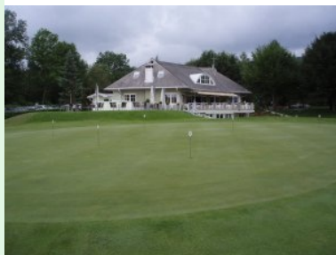
Das Clubhaus des GC Moosburg - Pörtschach

Nördlich von Pörtschach am Wörthersee liegt die 18+9 Loch Anlage des Golfclubs Moosburg - Pörtschach