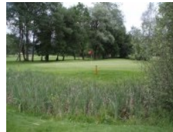
Grün Loch 14 (Par 4)

Fall Sie durch die Anordnung der Löcher auf der Homepage der Golfanlage in Moosburg verwirrt sind: Diese ist (im Mai 2010) nicht mehr aktuell. Offensichtlich wurde einerseits die Reihenfolge der Löcher teilweise geändert und auch ein Loch neu dazu gebaut - nämlich Loch 18, sodass die Runde beim Clubhaus und nicht wie vorher bei der Halfway Station endet. Diese Änderung wurde bei der "Virtuellen Tour" auf der Homepage noch nicht nachgezogen.