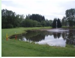
Teich auf Loch 16 (Par 4, 294m)

Im leicht hügeligen Umland nördlich des Wörthersees erstrecken sich die 27 Loch des Golfclubs Moosburg - Pörtschach. Der 18-Loch Platz bietet Parkland-Kurs Flair, jede Menge Abwechslung und weist einen guten Pflegezustand auf. Mehrere Teiche stellen eine Herausforderung für jeden Golfer dar. Einer gelungenen Golfrunde steht nichts im Wege. Der Platz erinnert mich an den Golfplatz Klopeinersee. Einzige kleine Wermutstropfen die erwähnenswert sind: Die notwendigen Querungen der Fairways (am Weg zur Driving Range und am Weg zu Tee 9) und die ungewöhnliche Farbwahl für die Distanz-Pflöcke.