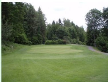
Grün Loch 2 (Par 4, 283m)

Halfwaystation bildet sich hier das Zentrum des Platzes.