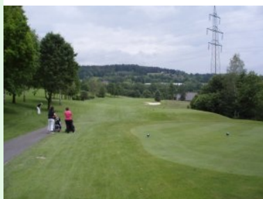
Loch 12 (Par 4, 376m)

zu spielen. Vor dem Grün quert auch noch ein Bach das Fairway. Loch 17 (Par 5, 426m) ist ein leichtes Dogleg links ehe Sie Loch 18 (Par 3, 180m) wieder zurück zum Clubhaus bringt.