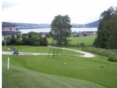
Abschlag Loch 1 (Par 5, 478m)

Clubhaus und die restlichen fünf Löcher liegen südlich der Straße. Am Weg zu Tee 1 quert man die Straße und geht entlang schöner Häuser ein kleines Stück bergauf. Loch 1 (Par 5, 478m von gelb) führt bergab und wird rechts entlang der gesamten Spielbahn von Wald begrenzt, dahinter liegt eine steil abfallende Schlucht. Der Teeshot von der hoch über dem Fairway liegenden Teebox führt über Hardrough und durch eine Engstelle (weil links ein paar Bäume stehen) auf eine breite Landezone. Vor dem Grün steht rechts am Waldrand eine Kapelle, man befindet sich hier direkt über Weyregg, etwa auf Höhe der Kirchturmspitze. Man blickt über Weyregg und den Attersee auf das gegenüberliegende Westufer mit der