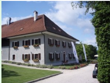
Das Clubhaus des Attersee GC Weyregg

Malerisch gelegene 9-Loch Golfanlage am Ost-Ufer des Attersees mit einzigartigem Panoramablick auf den Attersee von jedem Tee und Green