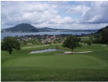
Grün Loch 9 (Par 4, 266m)

Anlage liegt oberhalb von Weyregg und bietet einen herrlichen Ausblick auf die Umgebung inklusive dem Attersee. Die Anlage ist gut gepflegt und auf jeden Fall einen Besuch wert. Nicht ganz dem modernen Stand der Technik entspricht leider die Homepage: Mit dem Firefox-Browser ist das Birdiebook ("virtuelle Runde") nicht darstellbar - man kann nicht zwischen den Löchern navigieren. Mit dem Microsoft Internet Explorer funktioniert das. Warum man für die virtuelle Tour auf der Homepage derart grausliche Bilder verwendet ist mir ein Rätsel.