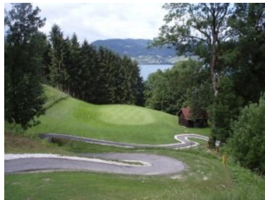
Loch 7 (Par 3, 156m, "Steiler Zahn")

von links nach rechts abfällt. Ein Roughfleckchen mit kleinen Bäumen kann Ihnen hier den Schlag auf das wunderschön am Waldrand erhöht liegende Grün erschweren. Dann folgt mit Loch 7 (Par 3, 156m) das Signature Hole in Weyregg. Das Loch liegt komplett im Wald und geht steil bergab. Die Teebox liegt auf einer Geländekante, das Grün in einer Waldlichtung. Jedes Loch in Weyregg hat einen offiziellen Namen, Loch 7 heißt passender Weise "Steiler Zahn". Loch 8 (Par 4, 350m) ist formal das schwerste Loch am Platz (Index = 1). Der Teeshot des Dogleg links führt durch eine Waldschneise waagrecht hinaus ins freie Gelände. Die Landezone hängt nach links, erweitert sich aber glücklicherweise trichterförmig. Nach dem Knie gehts dann bergab über einen großen Teich mit Böschung inklusive Rough aufs Grün. Wenn Sie bei dem Loch mit zwei Schlägen am Grün sind können Sie stolz sein! Das Fairway des abschließenden Loch 9 (Par 4, 266m) liegt an einem großen Teich und führt bergauf zum Grün in Sichtweite der Clubhausterrasse.