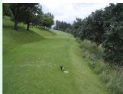
Tee Loch 6 (Par 4, 288m)

Ortschaft Attersee und den dahinter liegenden Hügeln. Loch 2 (Par 3, 138m) führt weiter bergab. Rechts und hinter dem Grün ist Out-of-Bound, vorne und links vom Grün lauern Bunker auf die Bälle. Loch 3 (Par 3, 119m) führt parallel zu Loch 2 wieder hinauf, das Grün ist tiefer gesetzt und rechts ist Out gepflockt. Loch 4 (Par 5, 430m) führt weiter bergauf. Rechts ist out-of-Bound, links ein Roughstreifen entlang des fast gesamten Fairways. Das Grün wird links vorne von mehreren Sandbunkern und zwei singulären Bäumen verteidigt. Jetzt geht's zurück zum Clubhaus und auf der anderen Seite weiter mit Loch 5 (Par 3, 169m). Die Bahn zieht sich quer zum Hang relativ eng auf ein Grün am Waldrand. Vor dem Grün verengen Bäume die Spielbahn und ein querender Wassergraben schluckt alle zu kurzen Teeshots. Der Teeshot von Loch 6 (Par 4, 288m) führt durch eine lange Alle von Obstbäumen hinaus auf einen Hang der