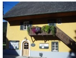
Das Clubhaus am Murhof

Oktober 2011 - Rund 25 km nördlich von Graz und rund 20 Autominuten von der Stadtgrenze von Graz entfernt liegt die Gemeinde Frohnleiten im Bezirk Graz-Umgebung. Der 18-Loch Championship-Course des Golfclubs Murhof liegt südlich von Frohnleiten im Ortsteil Adriach direkt an der Mur. Die Zufahrt von Süden (von Graz) kommend erfolgt über die Pyhrn-Autobahn bis zum Knoten Deutschfeistritz, dann weiter über die Murtal-Schnellstraße Richtung Bruck an der Mur, Abfahrt Peggau Nord/Badl. Die Zufahrt von Norden (von Bruck an der Mur) kommend erfolgt ebenfalls über die Brucker Schnellstraße, ebenfalls Abfahrt Peggau Nord/Badl. Der Weg zum Murhof ist von der Schnellstraße beschildert, die Anlage liegt nur wenige