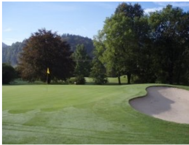
Grün Loch 7 (Par 5, 432m)

ehe dann mit Loch 14 (Par 5, 458m) das für mich schönste Loch und auch das Signature-Hole am Murhof folgt. Das Fairway schmiegt sich über die gesamte Länge im leichten Rechtsknick um den großen Teich. Bis auf ein paar vereinzelte Bäume ist der Bereich hin zum Wasser offen. Hier rate ich davon ab zu aggressiv die direkte Linie zu spielen, die Gefahr eines Wasserballs ist zu hoch. Das Grün vorne am Wasser wird auch noch von zwei Sandbunker bewacht. Das Tee von Loch 15 (Par 4, 381m) ist der nördlichste Punkt des Golfplatzes, Loch 15 und Loch 16 führen parallel zur Mur (die man aber nicht sieht sondern nur fließen hört), Richtung Süden. Zwei singuläre Bäume, die auf der rechten Seite des Fairways von Loch 15 stehen, machen den Golfern das Leben schwer. Loch 16 (Par 3, 139m) ist eigentlich ein Loch zum Verschnaufen - nicht aber im Falle meiner Runde am Murhof.