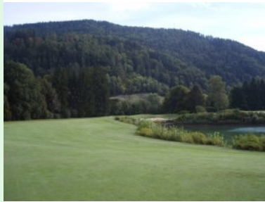
Loch 14 (Par 5, 458m) am großen Teich

Zwei Golfer kommen mit schnellem Schritt auf meine Flightpartnerin und mich zu und beginnen zu fragen wann wir unsere Runde gestartet haben und auf welchem Loch wir