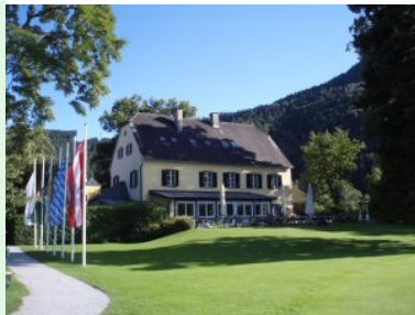
Das Golfhotel am Murhof

Ein wunderschöner Parklandkurs, top-gepflegt und eine gute Mischung aus Bodenständigkeit und Gediegenheit