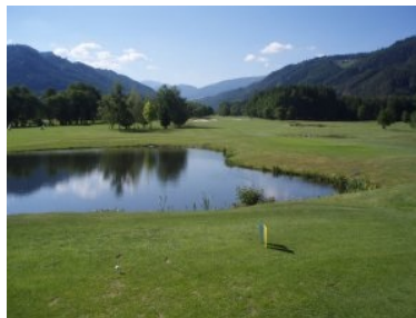
Abschlag Loch 1 (Par 5, 442m)

Die Zufahrt zum Golfplatz erfolgt über die Murtal Schnellstraße, Abfahrt Knittelfeld West oder Zeltweg Ost, danach ist der Weg