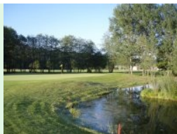
Grün Loch 12 (Par 5)

begrenzt. Loch 17 (Par 4, 321m) wird ebenfalls links von Wald und Out begrenzt, das Grün liegt wunderschön in einer Waldlichtung. Der Teeshot vom Loch 18 (Par 4, 385m) erfolgt aus einer Waldschneise raus, links ist Out (Driving Range), rechts liegt der Teich von Loch 1.