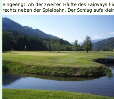
Grün Loch 3 (Par 3, 129m)

einem Hügel neben dem Clubhaus, der Teich vor dem Hügel sollte eigentlich nicht ins Spiel kommen (dafür aber später auf Loch 9), gefährlicher ist da schon der Teich weiter vorne rechts auf Höhe der Landezone. Später - auf dem parallel in Gegenrichtung verlaufenden Loch 18 - kommt dieser Teich wieder ins Spiel. Es folgt mit Loch 2 (Par 5, 495m) ein schurgerades Loch ehe mit Loch 3 (Par 3, 129m) ein optisch sehr schönes Loch kommt. Des kurzen Par 3 wartet mit einem Halbinselgrün auf. Links vom Grün steht das Blockhaus das uns im Verlauf der Runde noch öfter unterkommen wird. Loch 4 (Par 4, 385m) ist ein schweres Loch (Index = 2). Das Fairway in der Landezone ist durch Bäume links und rechts