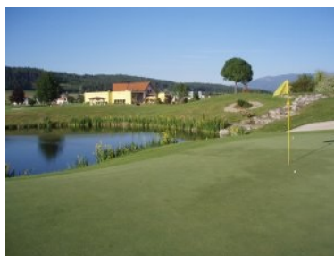
Grün Loch 9 (Par 4, 353m) mit dem Clubhaus

Die Zufahrt zum Golfplatz erfolgt über die Murtal Schnellstraße, Abfahrt Knittelfeld West oder Zeltweg Ost, danach ist der Weg zum Golfplatz mit grünen Schildern gekennzeichnet. Der Golfplatz liegt am nördlichen Rand der Gemeinde Spielberg am Fuße der Seckauer Alpen. Gebirgsbäche schlängeln sich idyllisch zwischen die Fairways und machen das Golfen auf dem vollkommen ebenen Platz zu einem wahren Genuss.