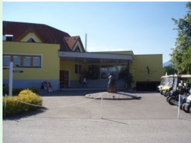
Das Clubhaus des GC Murtal

zum Golfplatz mit grünen Schildern gekennzeichnet. Der Golfplatz liegt am nördlichen Rand der Gemeinde Spielberg am Fuße der Seckauer Alpen. Gebirgsbäche schlängeln sich idyllisch zwischen die Fairways und machen das Golfen auf dem vollkommen ebenen Platz zu einem wahren Genuss.